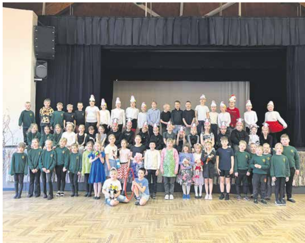
Fotol AKG 1.a, 1.b, 2.a, 2.b, 3.b klassid.