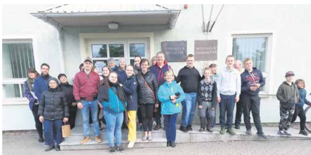
2022. aasta muuseumiöö matkaseltskond.

Mõisaküla muuseumis saab vaadata kolme näitust, mis on pühendatud raamatuaastale. Mõisaküla muuseumi kogudes on palju vanu õpikuid. Sel korral on vaatamiseks eesti keele ja kirjanduse õpikuid, millest vanim on pärit aastast 1875. Viljandi muuseumi kogudest on külastajatele vaatamiseks kaks postkaardikomplekti: näha saab 1935. aasta raamatuaas-