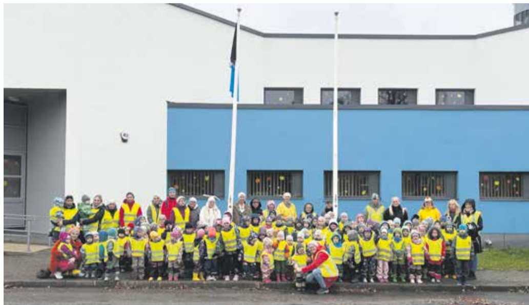
Mulgi lipu heiskamine 10. oktoobril 2024.