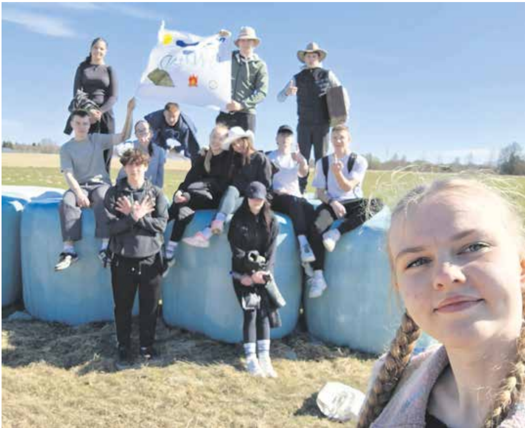
Taolised mõõduvõtmised süvendavad sõprussidemeid ning õpetavad üksteisega arvestama.