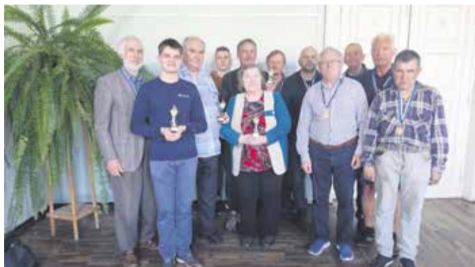
Turniiril Mulgi Male 2025 IV etapil osalejad.