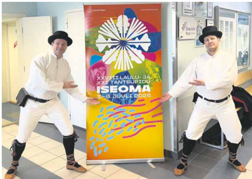
Kannapööre mehed on peoks valmis.