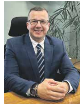
DMITRI ORAV vallavanem

Soovin kõigile kaunist ja rõõmurikast kevadet!