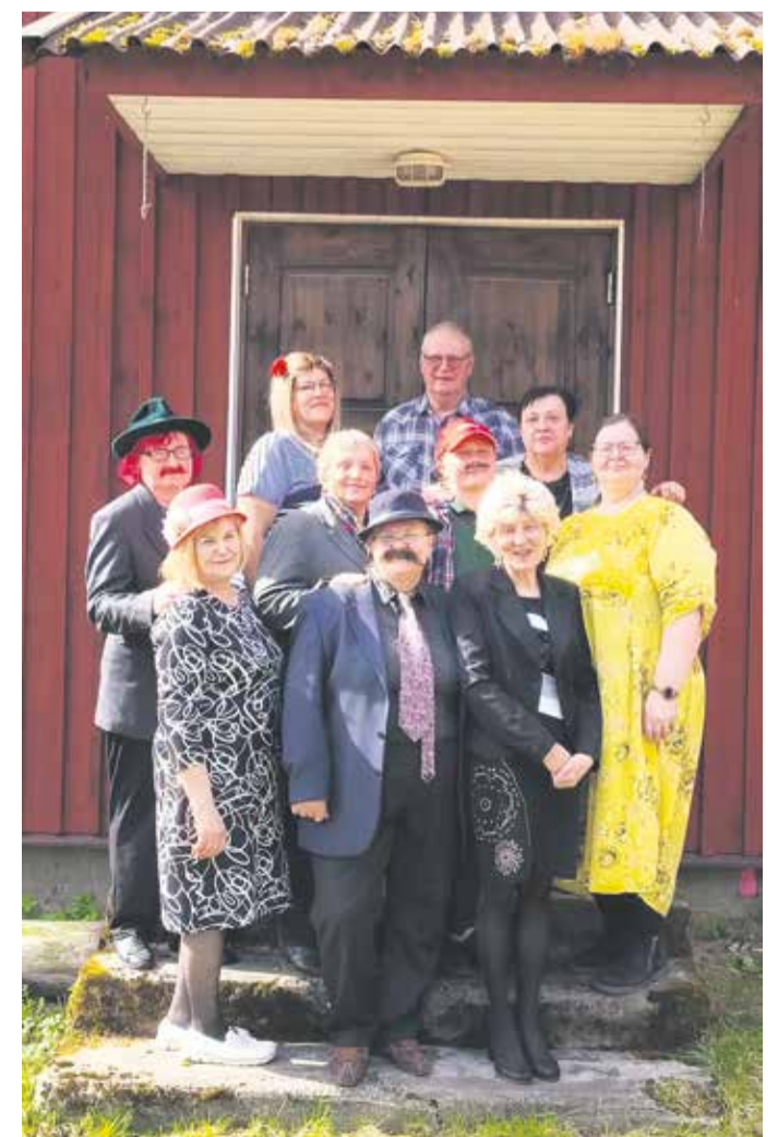
Näiteringi liikmed täies öies.