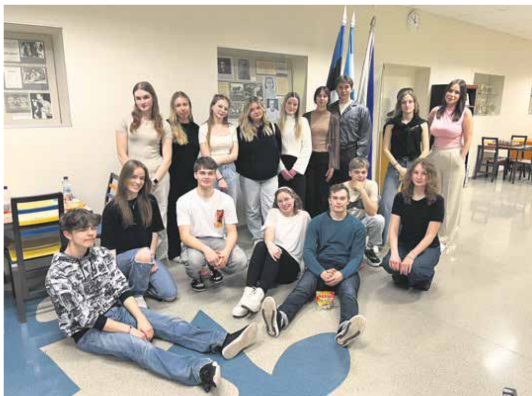
Fotol öökooli korraldajad.

Seejärel said osalejad valida kaks töötuba, kust ammutada uusi teadmisi ja kogemusi. Töötubade valik oli mitmekesine: