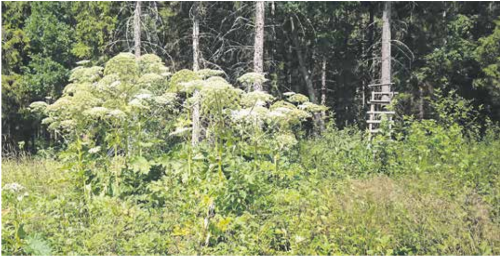
Karuputke võõrliik raiesmikul.