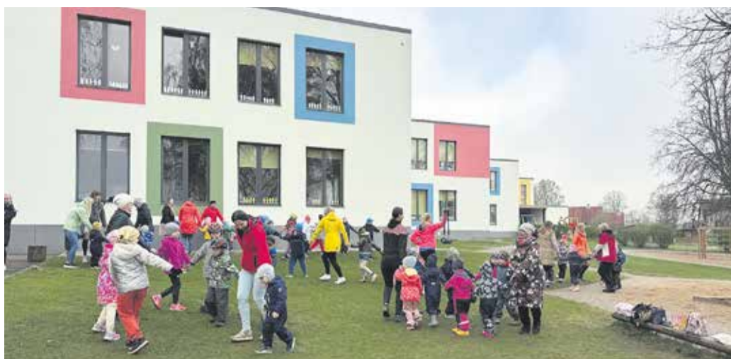
Rahvusvahelise lasteaedade päeva tähistamine 21. aprill 2025.