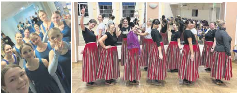
Esimest korda võimlejatena, rühm Piirikpääd, enne ülevaataust.