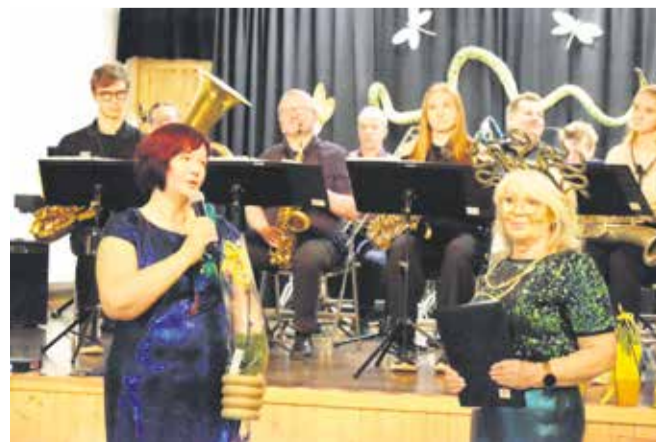
Maoaasta pidu oli algusest lõpuni rõõmsameelne ja glamuurne.