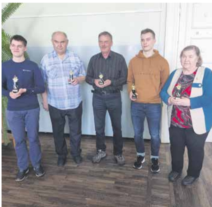
Turniiri Mulgi Male 2025 võitjad.