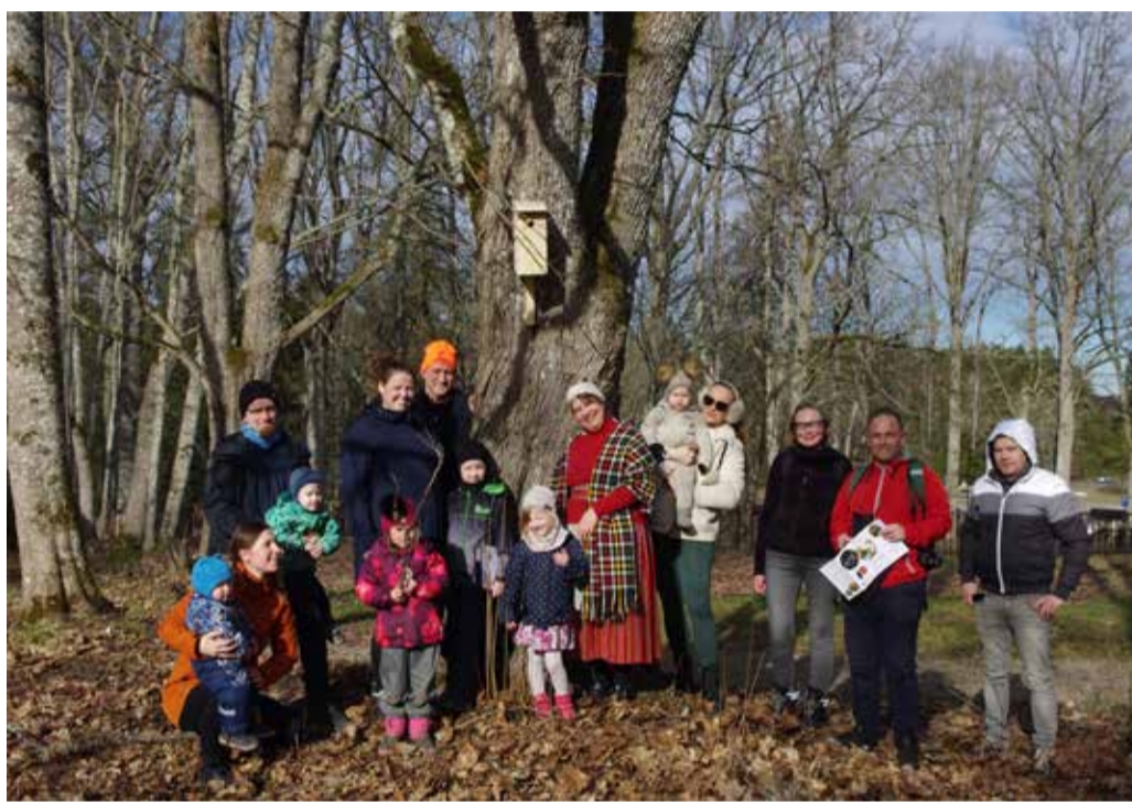
Perepäev - lumest, linast ja lindudest.