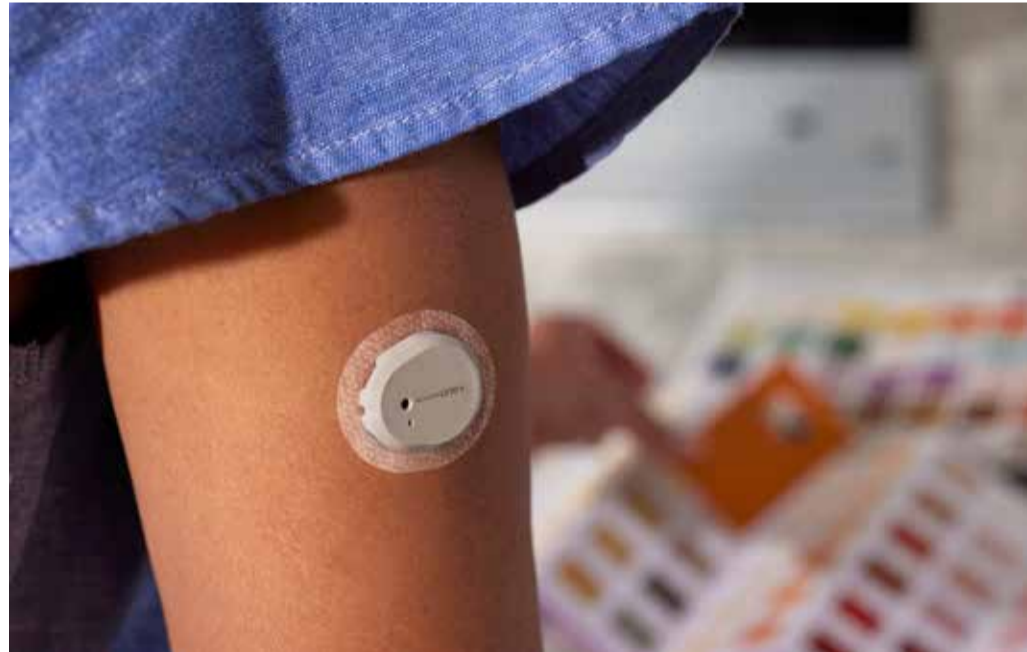
Käsivarrele paigaldatud sensor.

Diabeedispetsialist toob välja Tervise Arengu Instituudi (TAI) loodud toidu koostise andmebaasi, kust on võimalik näha,