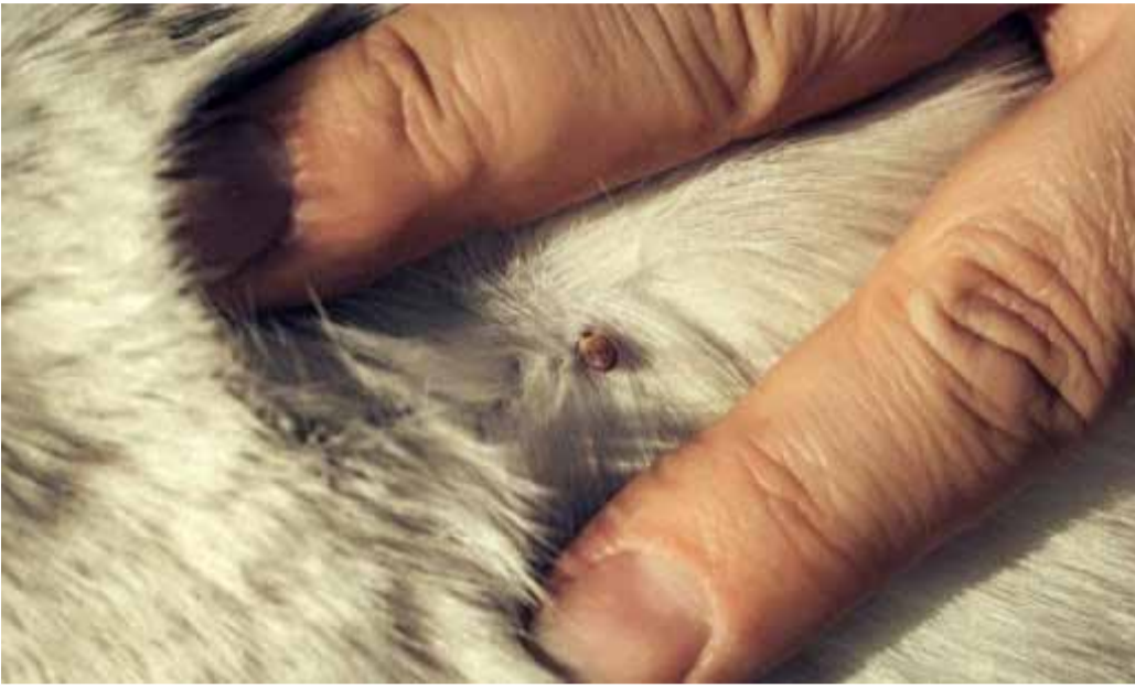
Puugirohkel ajal tuleb lemmikloomale karvkate pärast iga jalutuskäiku üle kontrollida ja leitud puugid kiiresti eemaldada.