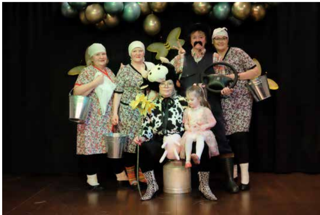
Tantsurühm Aerodünaamilised tantsuga „Tule maale elama“.

Eraldi tähistamist väärrib showtrupp Aerodünaamilised Halliste rah-