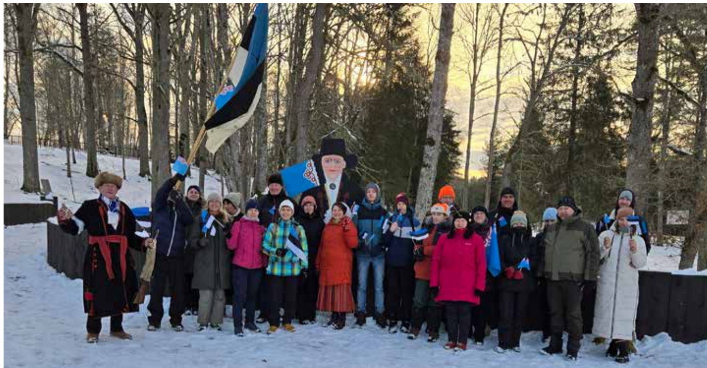
Vabariigi aastapäeva matk.