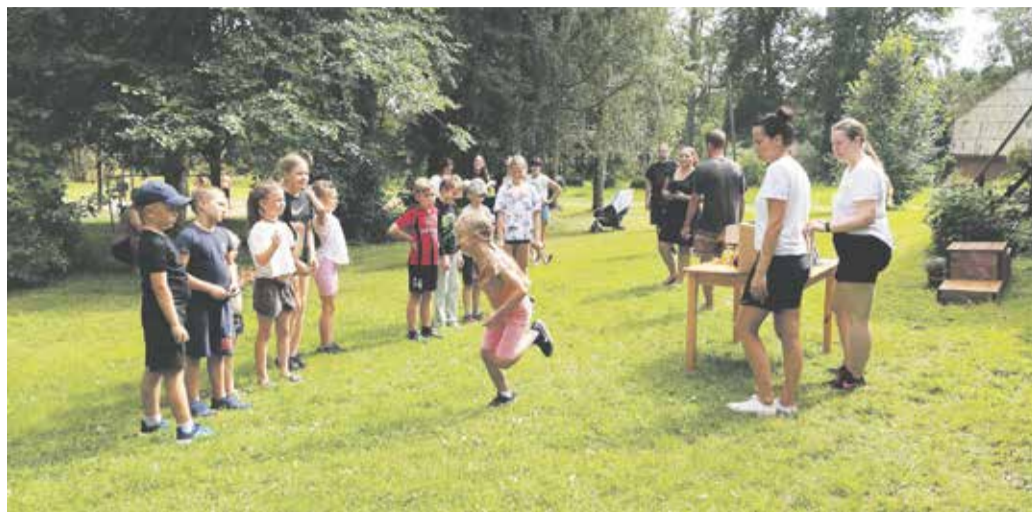
Lapsi osales võistlusel palju.

Juuliku viimasel laupäeval koguneti taas Uue-Kariste rahvamaja juurde, et tuua kokku pered ja nautida koos liikumist. Selline traditsioon on meie piirkonnas juba kahekümnendat korda ja seega teatakse, et juuliku viimane laupäev on spordipäev.