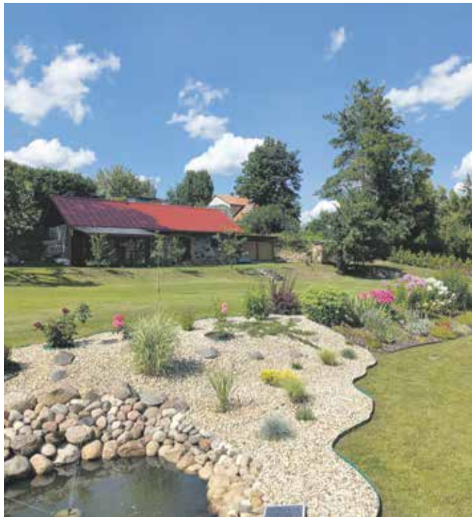
Kaunid lillepeenrad paistsid silma kõikides konkursile esitatud kodudes.

Mulgi valla kauneim kodu 2024 on paljudele tuttav Vana-Küti talu Sudiste külas. Vana Küti talus on paljud kodukohvikute sõbrad käinud juba aastaid, kuid Karksi kihelkonnapäevade raames avab pererahvas oma koduhoovi kõigile huvilistele. Kaunite lillepeenarde, niidetud muruga korda tehtud vana talupaik on loodud