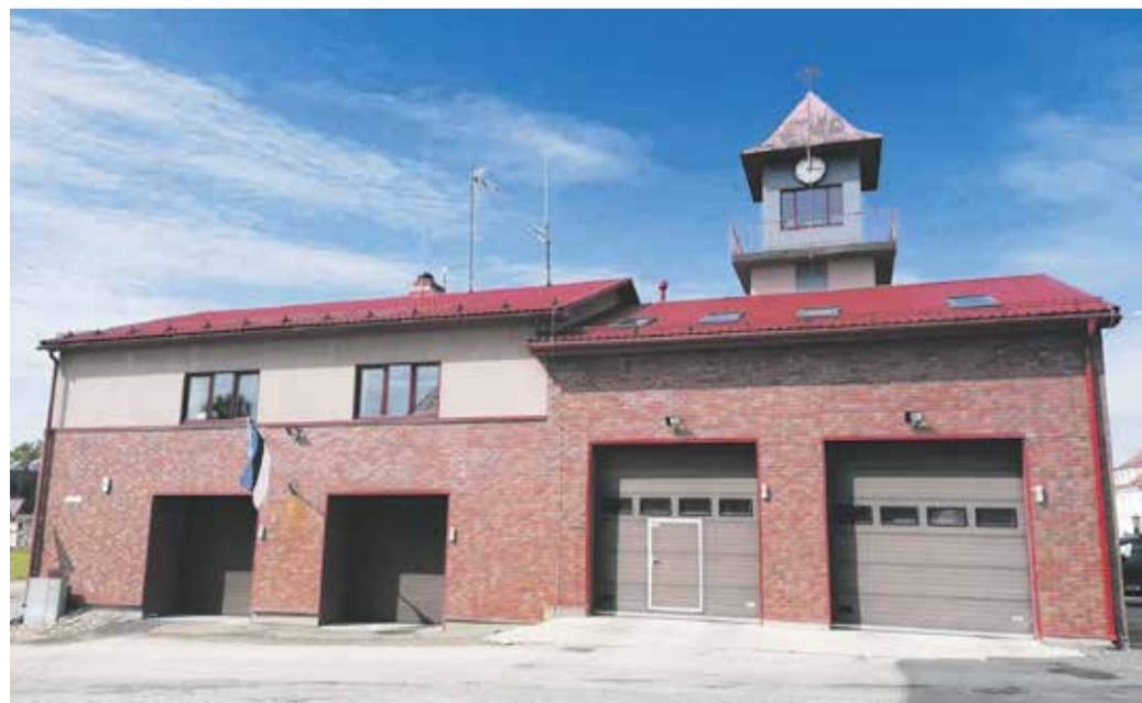
Abja-Paluoja päästekomando depoohoone aastal 2024.