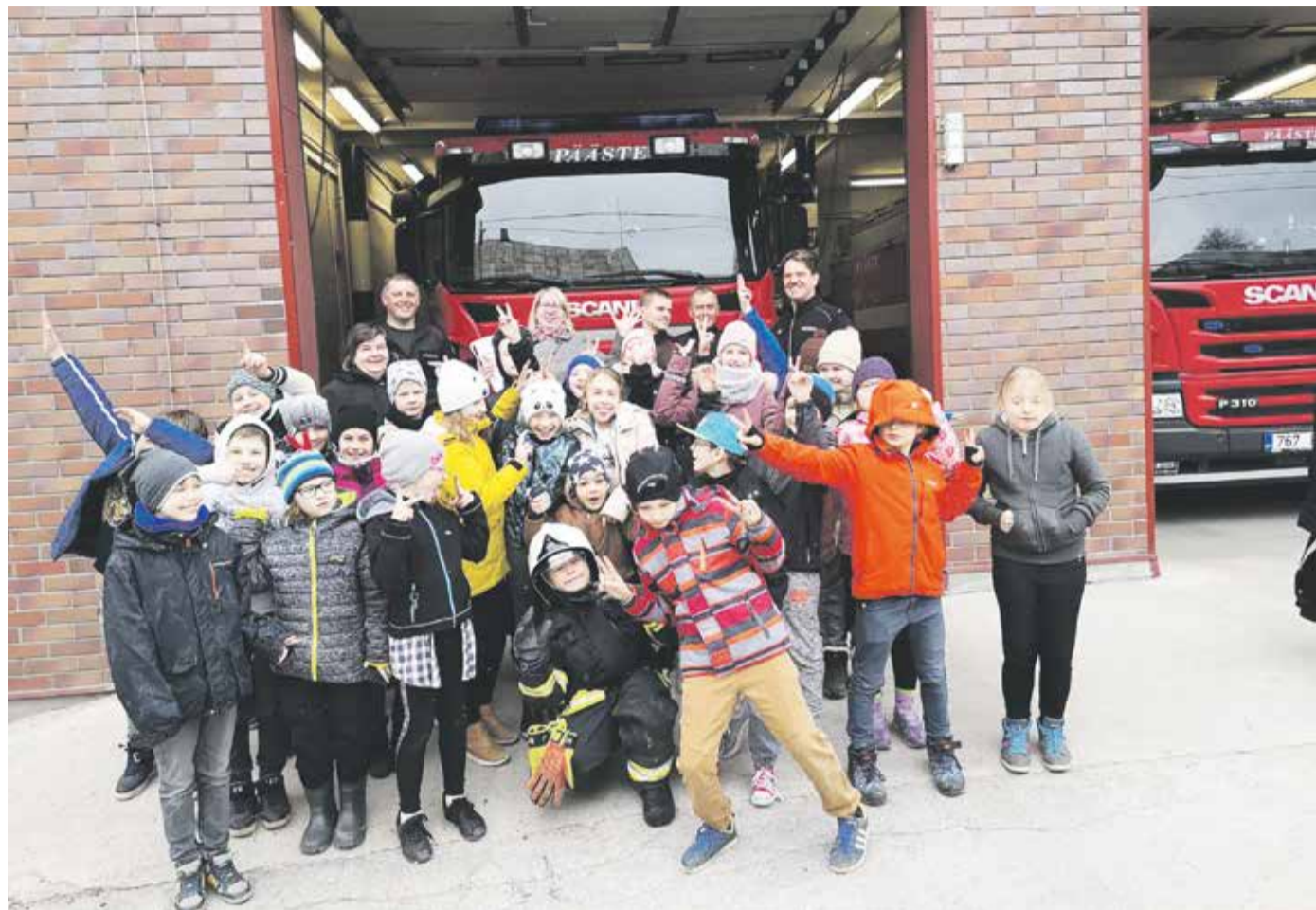
Lapsed päästjatel külas.

Juhtuvad õnnetused toovad enamasti enesega kaasa mingisuguse kahju, olgu see varaline, või veel