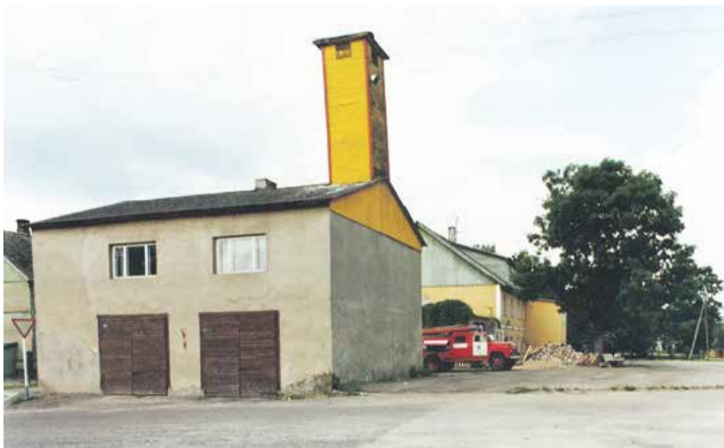
Abja-Paluoja päästekomando depoohoone aastal 1994.