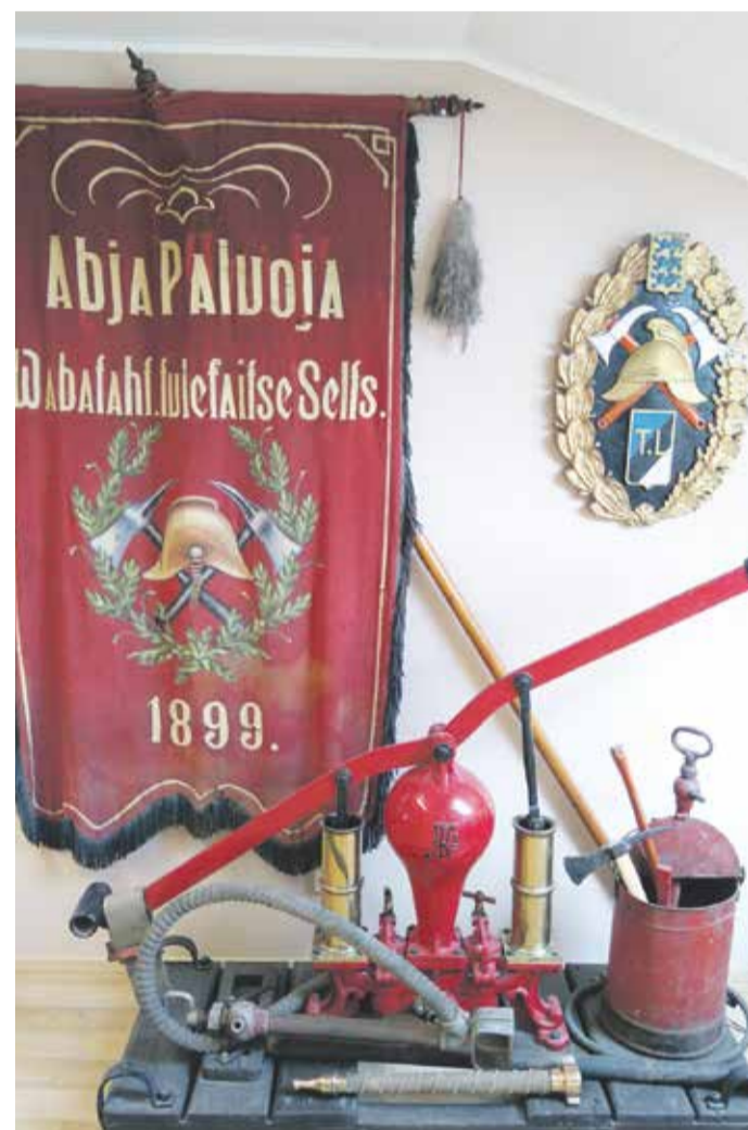
Abja-Paluoja Vabatahtliku Tulekaitse Seltsi lipp.