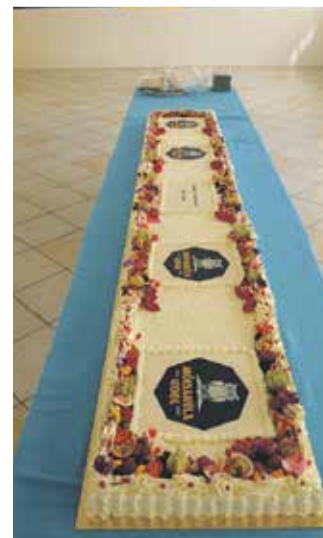
Viimase koolipäeva lõputort.