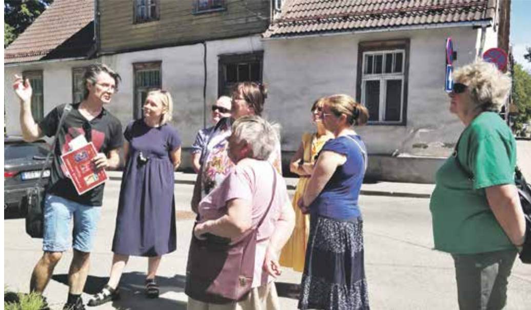
Kirjandustuuri osalejad said palju uut infot.