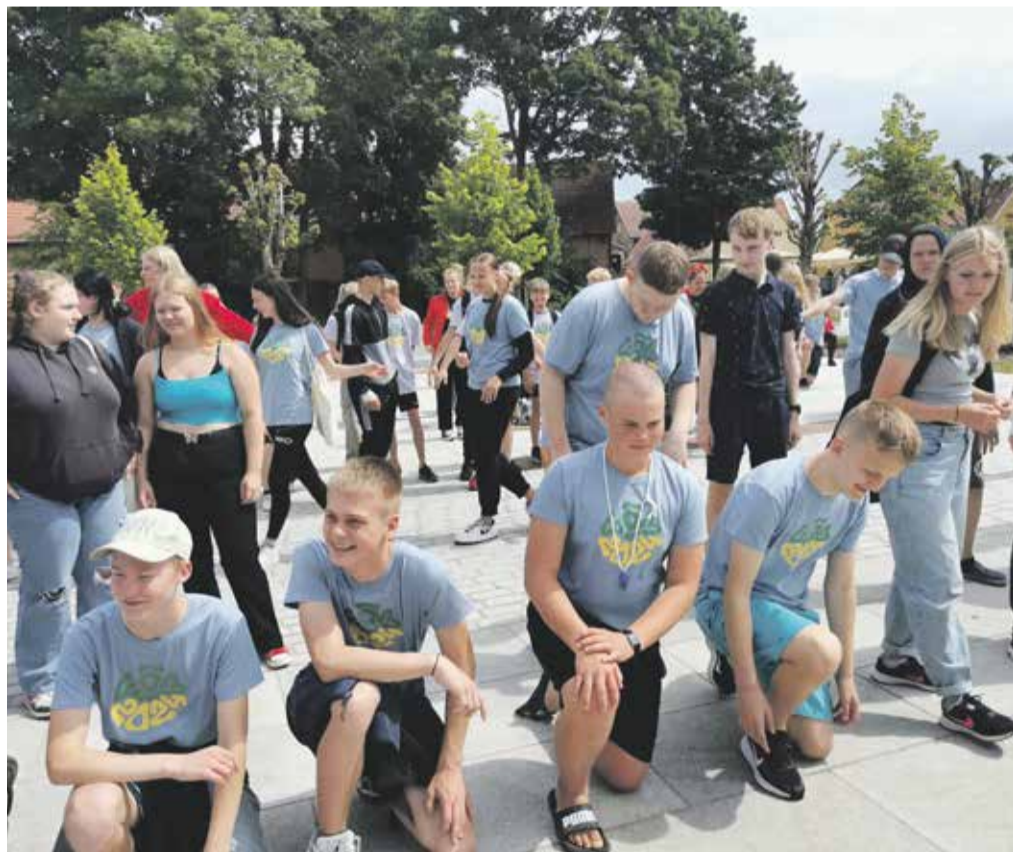
Mulgi valla noored malevlased Viljandimaa malevasuve avamisel.

Samuti pidid nad osalema töövestlusel, et läbi mitteformaalse õppe oleksid noored tulevikus valmis juba teadlikult sisenema tööturule. Igal aastal teeb töötukassa erinevaid põnevaid koolitusi, et arendada noores ettevõtlikkust ja anda