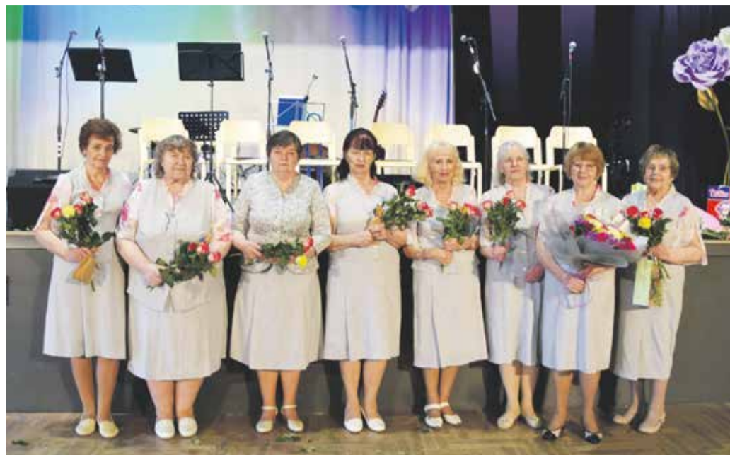
Nooruslikud Hõbeniidi lauljad oma juubelikontserdil.

Vanadus?! Väga suhteline mõiste. Veel mõnikümmend aastat tagasi oli 50aastane väga vana. Siis seostati vanurit kortsus palge, väsinud ilme, tihti ka lagunenuid hammaste ja kühnus rühiga. Ja kui olid vana, siis polnud sul asja kodust välja tulemisel. Nüüd on asjad sootuks teisiti. Targad inimesed on öelnud, et inimene on vana siis, kui