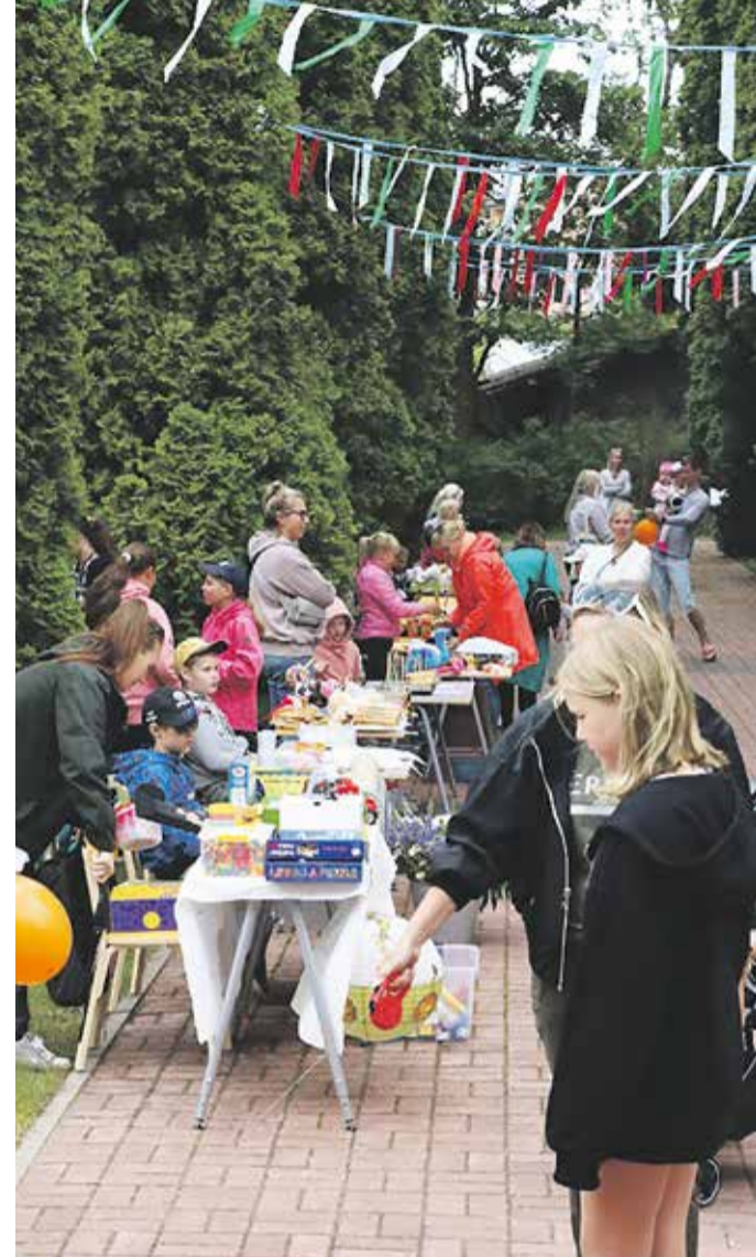
Laadal pakuti laste poolt valmistatud kaupa.