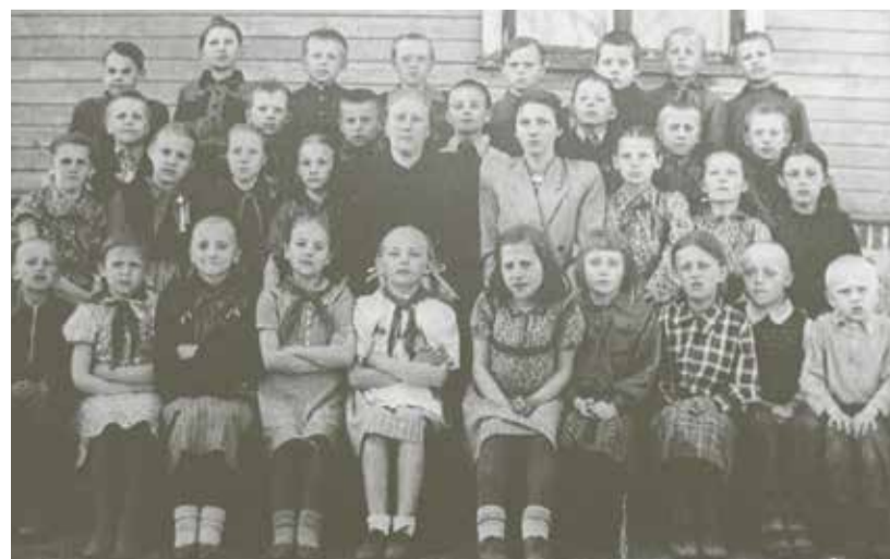
1953. aasta I–III klassi lõpupilt.