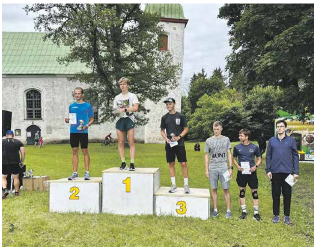
Jaanijooksu meeste parimad.