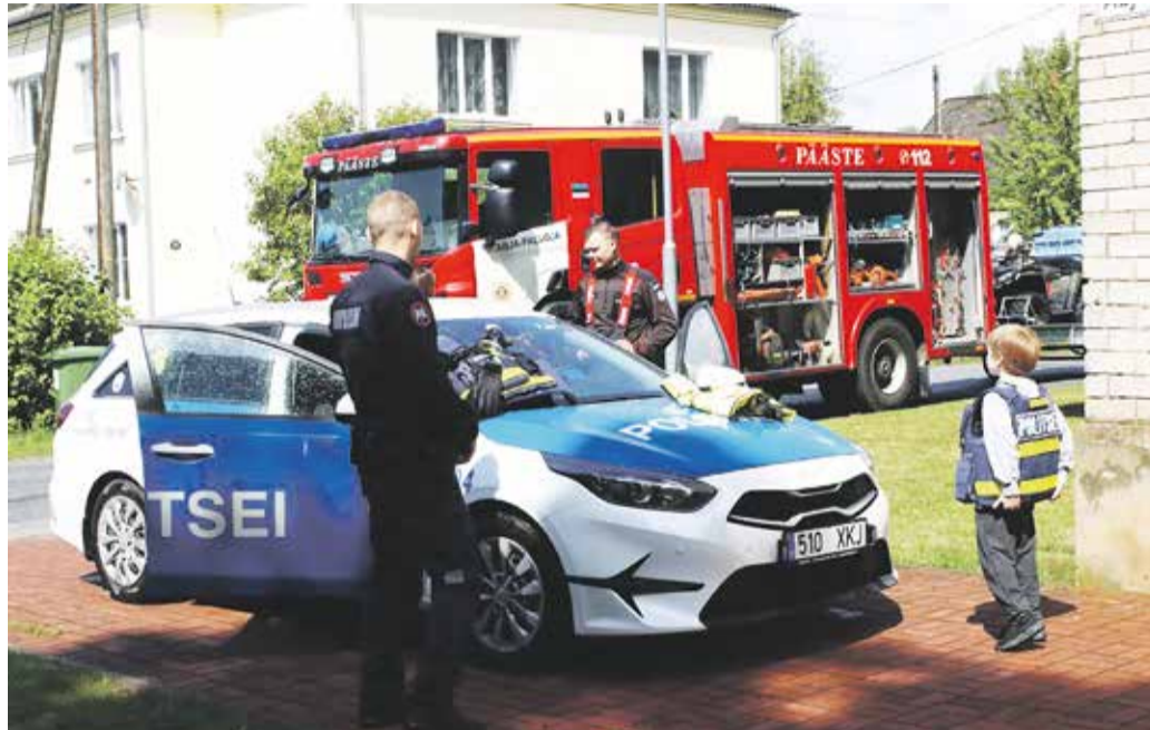
Päästjad ja politsei tutvustasid oma tegemisi.

Kooliõuel avatud mängude ala pakkus lastele lõbusat tegevust kogu päeva vältel. Muusikalist elamust pakkusid Muuvistuudio