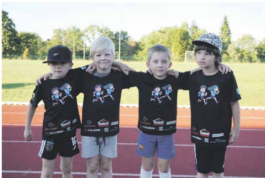
Lapsed uhkelt uusi võistlussärke kandmas.

Kolme etapi kokkuvõttes selgusid parimad neljas vanuseklassis (U6, U8, U10 ja U12), seeriavõistluse arvestusse läks kaks parimat tulemust igal alal. Iga ala tulemuse eest sai vastavalt punkttabelile punkte ning punktid liideti kokku ning selgusidki parimad.