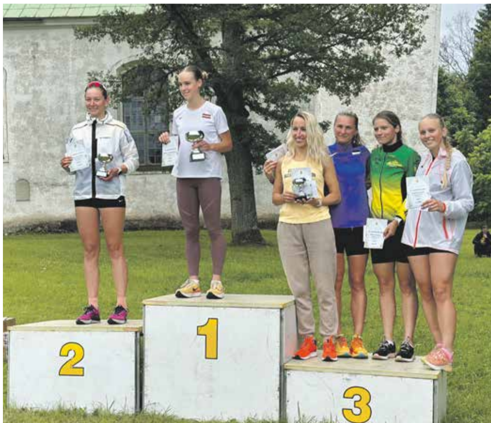
Jaanijooksu naiste parimad.