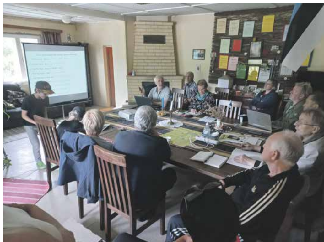
Koolitus Rimmu külamajas.

Enne sõda korraldas jõgede ja järvede hüdroloogilist uurimist 1921. aastal asutatud Sisevete Büroo. Erilist tähelepanu pöörati jõgede üleujutuse all kannatavaile piirkondadele, et veeolude korraldamisega luua paremad tingimused põllumajanduse jaoks ning selgitada veejõu kasutamise võimalusi. Pealegi oli 1920. aastal Eestis viimase pooleteise sajandi kõige veerikkam ehk uputuslik periood. Soomaa on Eesti kõige suurem ja tuntuim sisemaine üleujutusala, kuid selle jätkuks võime lugeda ka Kõpu jõe keskjooksu lõiku Öisu järve ja Rimmu vahemikus. Seepärast tuligi uurida selle piirkonna veerežiimi, et saada selgust maaparan-