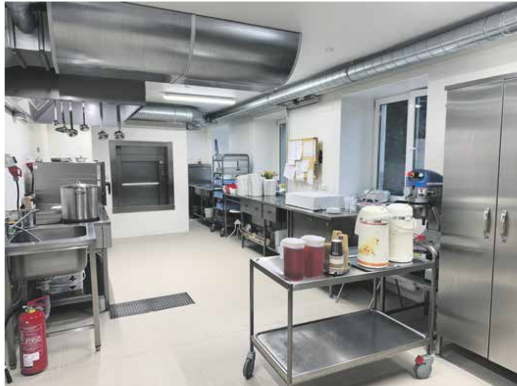
Abja haigla uus köök on avar ja ruumikas.

Ehitustööd kestsid kokku kuus nädalat, ehitajaks kohalik ehitusettevõtte Ramia OÜ. Selle ajaga said ettevalmistustöödena lammutatud vahesein, müüritud kinni üks aken, lõhutud seinelt ja põrandalt lahtised ja pragunenud keraamilised plaadid. Ettenägematu tööna tuli välja vahetada kogu veetorustik ja seintele ehitada uus aluskarkass plaatimiseks. Ülesehitustööd andsid avara ja heledate seintega tööruumi, uued avatavad aknad ja oluli-