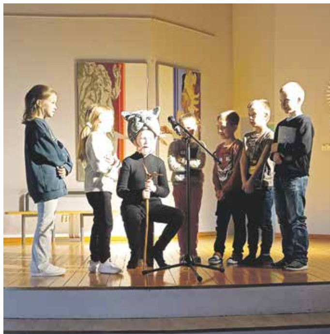
Väikesed näitlejad laval.

Koolielu on kiire, üks jaht ajab teist taga ja seetõttu jäi teatritegemiseks märtsikuus päevi väheks. Halliste põhikoolis tähistati teatripäeva hoopis 5. aprillil. Varasemalt oleme teatripäeva pühendanud Jaan Rannapi, Eno Raua ja Ellen Nüüdu loomingule, siis seekord oli lavale oodatud