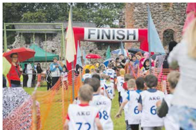
Jaanijooks on Mulgi valla suurim spordisündmus.