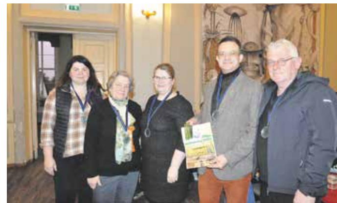
III koht Saapaküla.