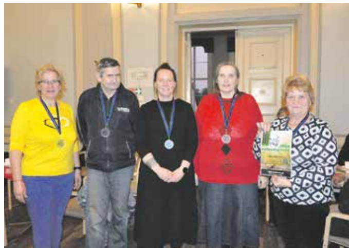
I koht Õbeäidsme.