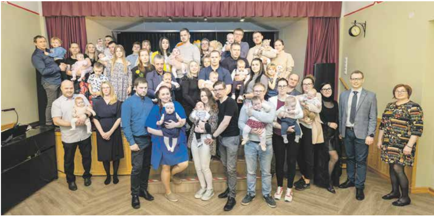
Lusikapeol Mõisaküla kultuurimajas