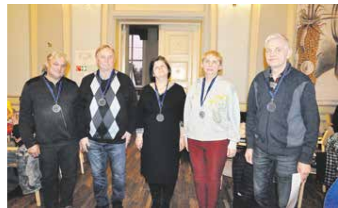
II koht Tuhalaane.