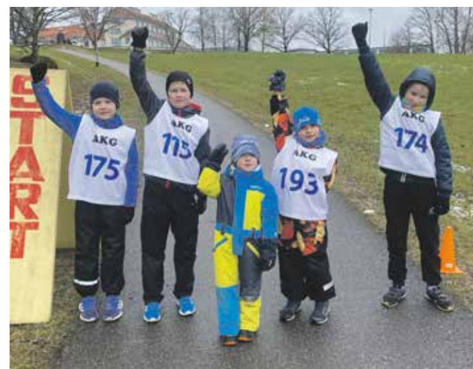
Kitzbergi mäejooksul osalenud lapsed.