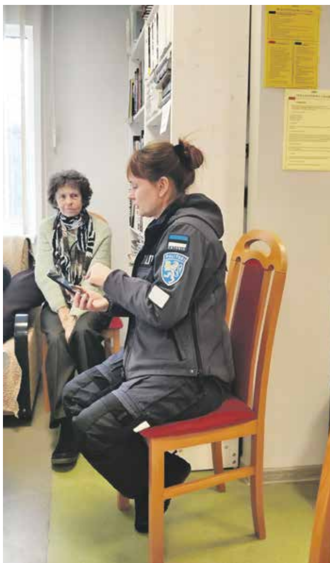
Vestlusring veebipolitseinikuga.