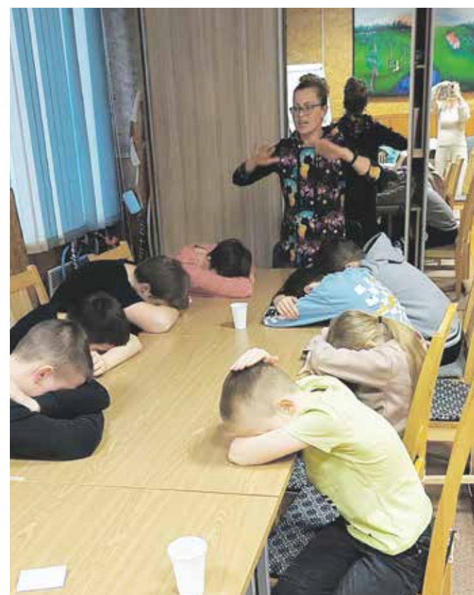
Mindspringil osalevad noored osalesid põnevates mängudes.

Koolitaja Oksana sõnul on Mulgi vallas suurepärased Ukraina lapsed, kõikidest tema gruppidest on see kõige edukam; nad mõtleavad kaasa, nad kuulavad, nad