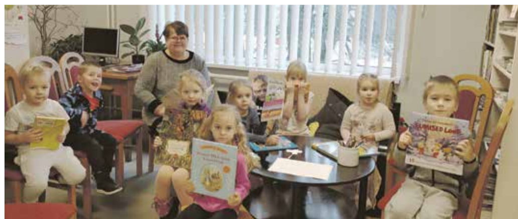
Õisu lasteaia mudilased raamatukogus eesti kirjanduse päeval.