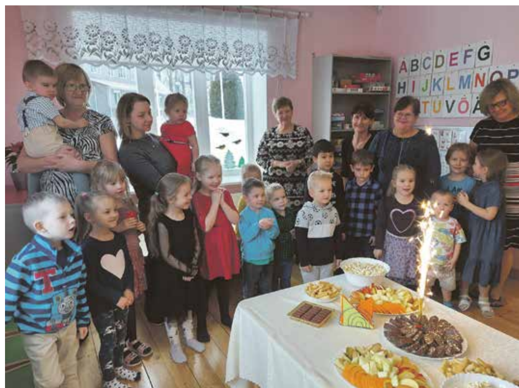
Sünnipäeva puhul said lapsed tordiga maiustada.

See oli parim päev ka meile – pidada sünni-