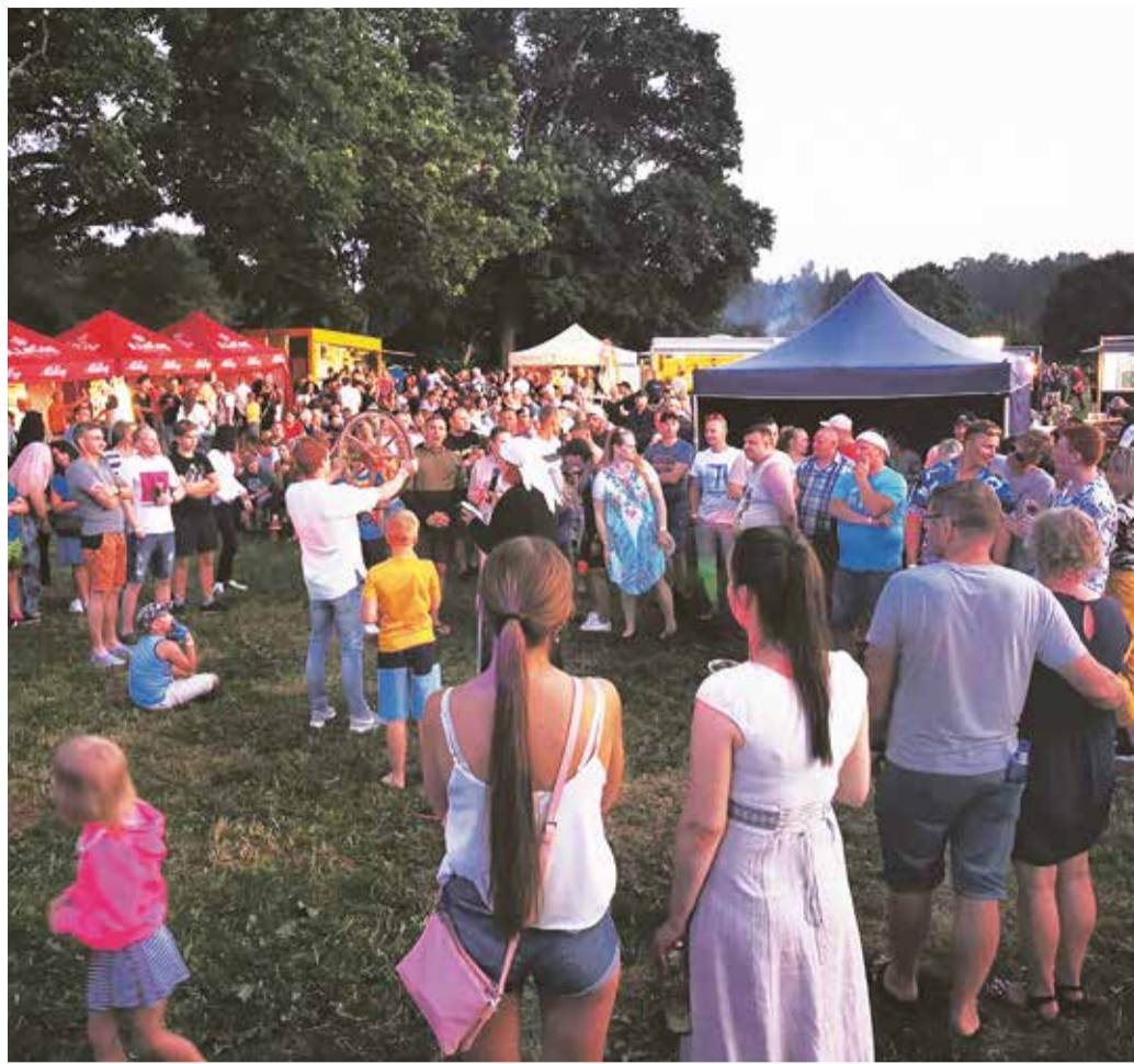
Lõbusad jaanimängud on osa peost.

Pikal sõidul olles leppi-sime abikaasaga omava-hel kokku, et tagasi tulles peab selle raske otsuse ka vallale/üldsusele „amet-likuks“ tegema. Olin seda ise pikalt edasi lükanud, sisimas lootes, et äkki ikkagi ...!