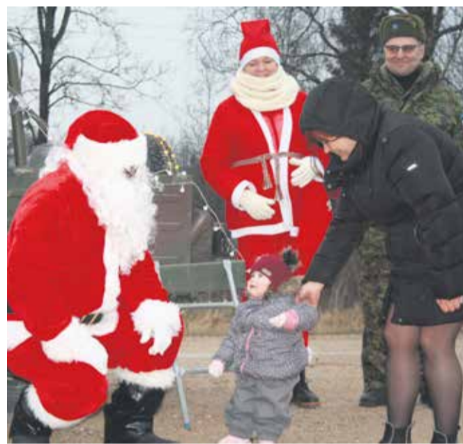
Meribel jõuluvanaga tutvust sobitamas.