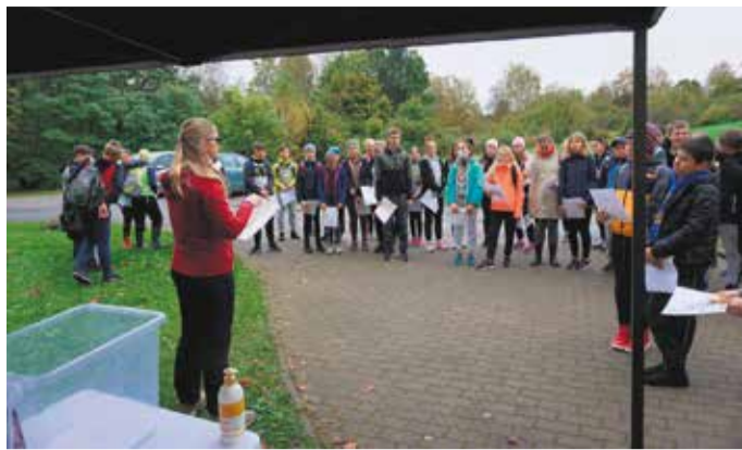
Spordinädala raames toimunud orienteerumispäevakust võtsid osa kõikide Mulgi valla koolide õpilased.

MTÜ Spordiklubi Halliste loodi 2004. aastal eesmärgiga elavdada Halliste valla spordielu. Tegutsemise esimestest aastatest alates on spordiklubi vallavalitsuse toel taotlenud toetust erinevatest fondidest. Seda on saadud mahukateks investeeringuteks, nagu laste mänguväljakud ja Halliste koolimaja jõusaal. Mitme toetuse abil oleme korraldanud võistlusi, infopäevi ja koolitusi erinevate spordialade tutvustamiseks. On organiseeritud nii laagreid kui ka võistlusi, ikka selleks, et tekiks huvi ja harjumus spordiga tegeleda. Eelkooliealiste laste liikumisrühm alustas just nimelt spordiklubi algatusel, esialgu projektitoetuse abil, nüüd rahastab seda omavalitsus. Spordiklubi on suutnud alates tegevuse alustamisest kaasata väga palju rahalisi vahendeid