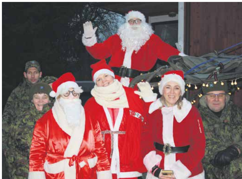
Uue-Kariste rahvamaja külastamas.

Päev ei toogi midagi seesugust, mis läbi aastate pisiasjadeni mees võiks püsida. Kolistame oma mänguasjadega, nurume vanaemalt ahviga kommi (nende maitse on siiani mees!), kiusame laisklevat koera ja meelitame enda juurde kapi otsas rahulikult põõnavat kõutsi. Öhtul süütavad vanaema ja tädi kuusel küünlad. Toas on väga valge ning seda täidab eriline, tänaseks unustustolmu alla peitunud lõhn. Lauale ilmuvad särisevad verivorstid ahjus küpsenud kartulitega. Peab tunnista, et me ei hooli neist väga. Ootame kõrvitsasalatiit nokkides piparkooke ja kommi ning aega, mil säraküünlad tule külge saavad. Suured inimesed on raadiole hääle sisse keeranud ja kuulavad kaua üle ainult vanale akuraadiole omaste häälsüsteemide lootsamängu helisid ning uudiseid. Lõpuks saame näha säraküünlaid, krabitada mõne kommi paberist välja ning peame enne viimaste küünalde kustumist