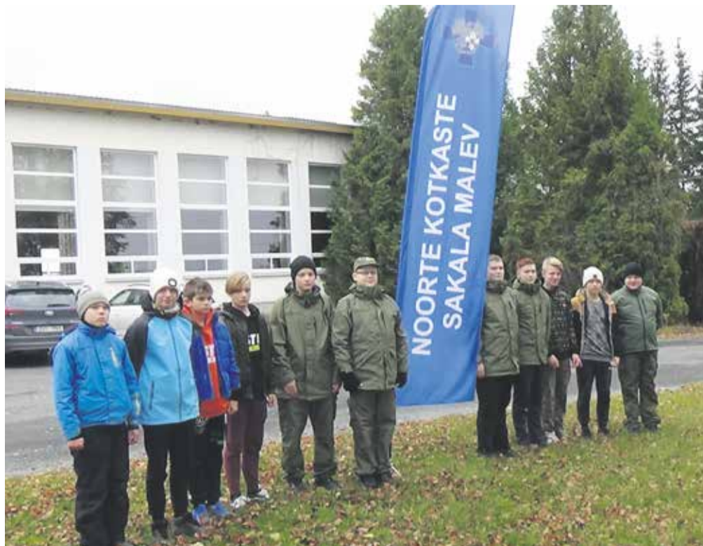
Halliste rühma noored oma viiendas sügislaagris.

Halliste noortele oli lähedusse hiilinud sügis eriti laagriterohke. Kuigi pandeemiast pajatati kõikjal taas üha valjemalt, sai septembris teoks üpris meeolukas jätkulaager Kaarli rahvamajas. Selle teostamiseks andis võimaluse ühise kevadise laagri asemel toimunud Loodi ühislaagri oluliselt väiksem maht ning isamaalise hariduse programmi (IHP) juhtide otsus lubada va-