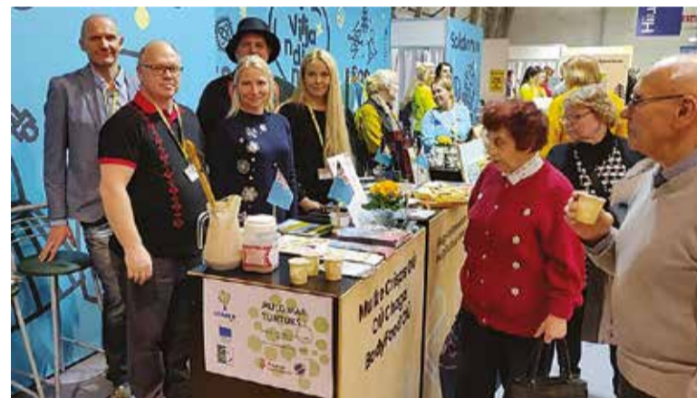
Veebruarikuul käisive mulgi oma kandist kõneleminen ja oma kaupa pakman nii Balttouri messil Riian ku Tourestil Talnan. Pildi pääl mulke punt Tourestil.