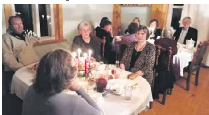
Seltsi aastalõpu koosviibimine Murri häärberis.