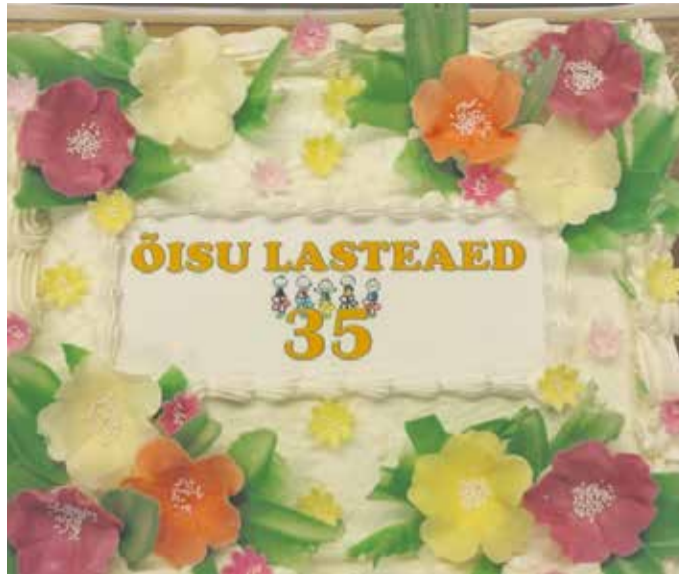
Sünnipäeval pakuti torti.