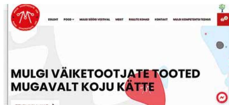
Keväde tei Mulgi Väiketootjate Liit valla e-poodi mulk.ee, kos pakutes nii süüki, käsitüüd ku muud mulgi värki.