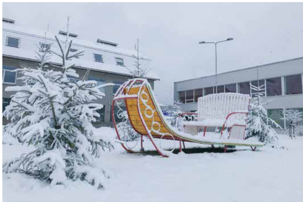
Jõulutraditsioonid jäävad kestma aegade kiuste.

Mitmed lapsed ootasid jõuludeks lund, sest valged jõulud tunduvad viimastel aastatel pigem erand kui