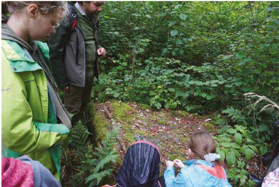
Lillin Timmo talu maade pääl om Ussikivi, mes om ollu kate talu ütime ohvrekotus. Köneldes, et Ussikivil ollu ennemb tapuaid ümmer. Kivi pääle om “värsket” ja mudu “äädmiilt” viitu, näituses uudseleibä või tapet looma liha. Ohverd viiti kah pühädes ja engipäeväs.

Millest sis Pelli-luu kõnele-ve? Kige rohkemb ohverdemisest. Pelli jaos ollive oma ohvrekotusse, ariliguld egäl talul eraldi. Enämbiste olli sii aid (nn tapuaid), kivi, sööti jäet maa vmt, kus viiti söögikraamist uudseohverd ek edimest ohverd, näituses villä, leibä, võid, õlut,