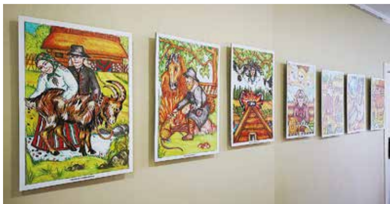
Minevaaste septembrekuul olli näitus “Ämäriguaa luu pilte pääl” vällän Tarvastu raamatukogun.