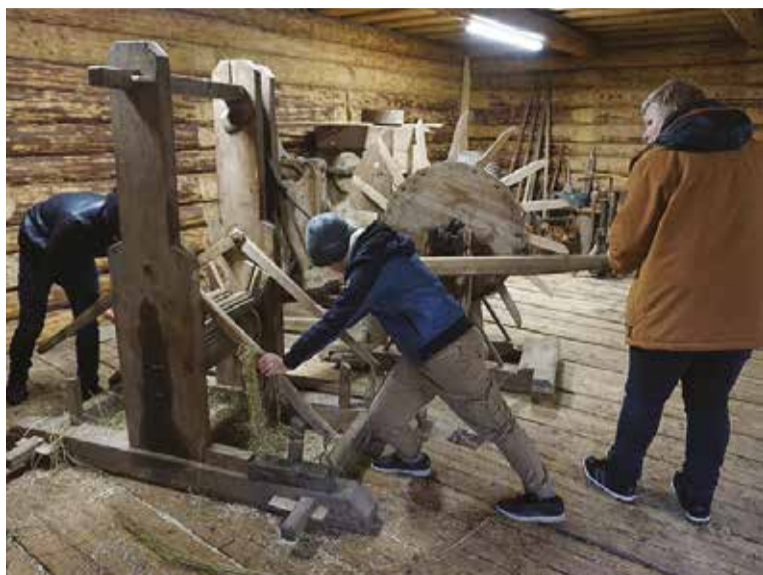
Luudusmaja aidan saap suure massinege lina murda.

Rogramm om kokku pant mitmest jaost. Kigepäält om väike jutusoõr Mulgimaast. Latse saave kaardi päält selges, kus Mulgimaa om, mitu kihelkunda siin om, mis om rahvarõovaste man esieralikku, kust om Mulgi nimi tullu, millege mulgi rikkas saive ja mida tähendeve värvi Mulgi lipu pääl. Latse tutvusteve endit kah mulgi keelen. Sis vaadetes tillikest vilmikest linatüüdest ja jagates latse viies kihelkunnas. Övven akkave kik rupi oma tüüsit tegeme. Üte saeve katemehesaage puid ja riivive kapstid, tõise söödäve kodujannessit ja obesit, kolmande niidäve einä, teeve akkurige peenikes ja viive kanadele, nelläs rühm akip kartult ja söödäp kitsi-lam-