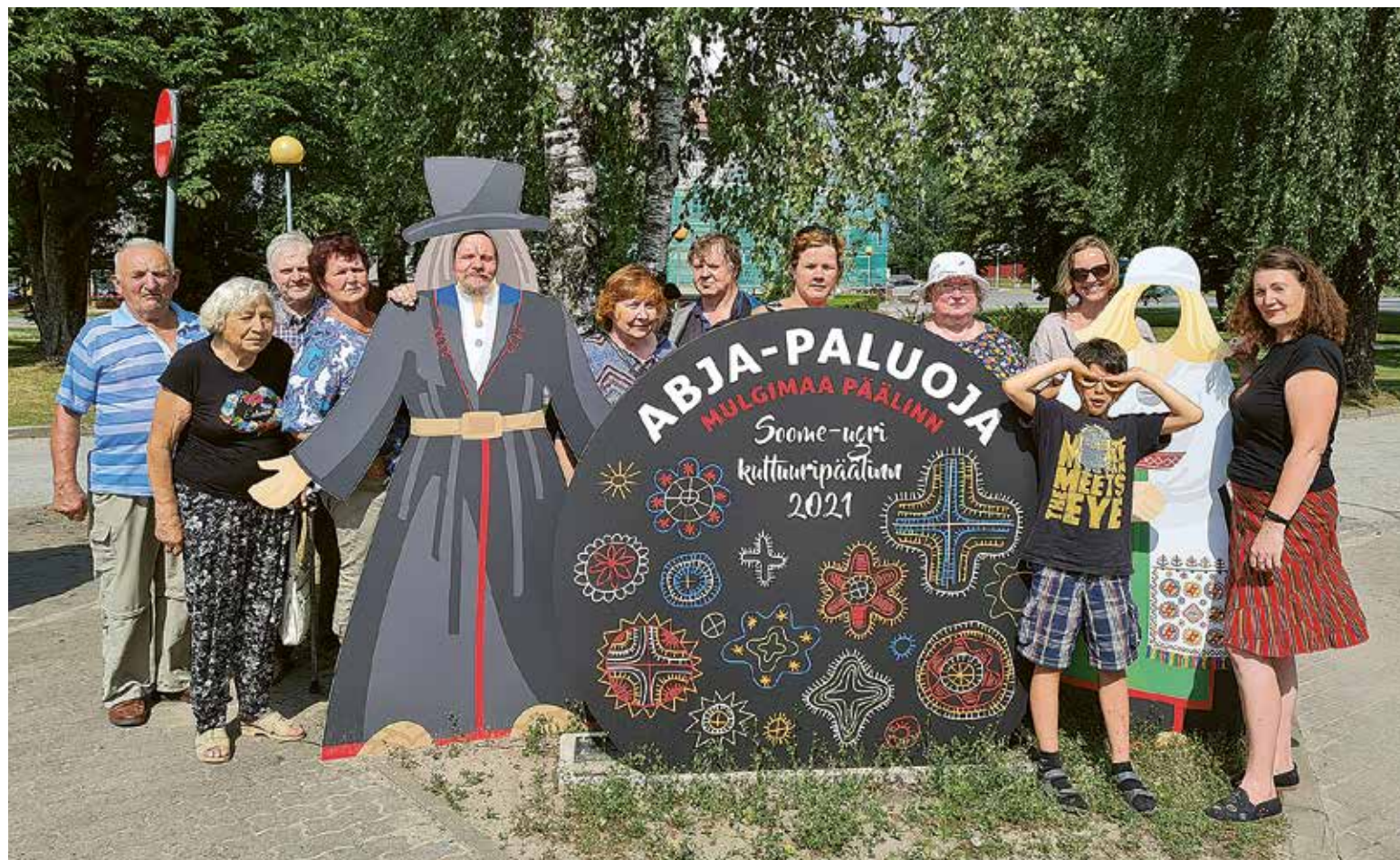
Tarvastu mulgi keele ring käis suvel Mulgimaa päälinnan ja Mulgi vallon uvireisil.