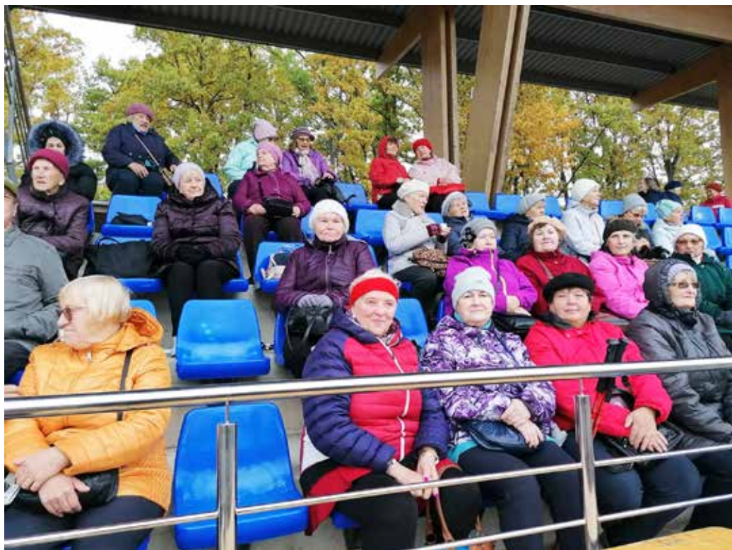
Esireas abjakad Viljandi Linnastaadionil.