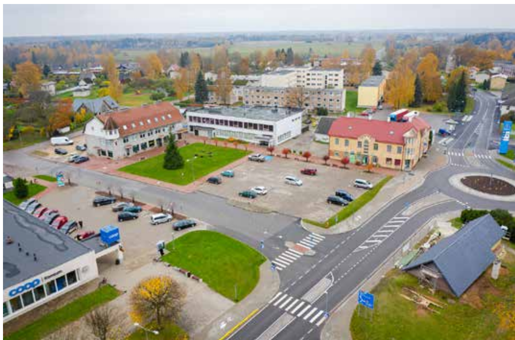
Karksi-Nuia keskvaljak 2021.

Nüüd on koosolekuid läbi viimas huvigrupi pinnalt sündinud ja hiljem veelgi mõttekaaslaste leidnud kogukonnatühendus Meie Mulgimaa, kes on sama missiooni jätkamas. Juulikuus osaleti nii Abja-Paluoja kui ka Karksi-Nuias kodukohvikute päeval ja korraldati ühised mõtetalgud, kus kogusime ja jagasime ideid, kuidas luua