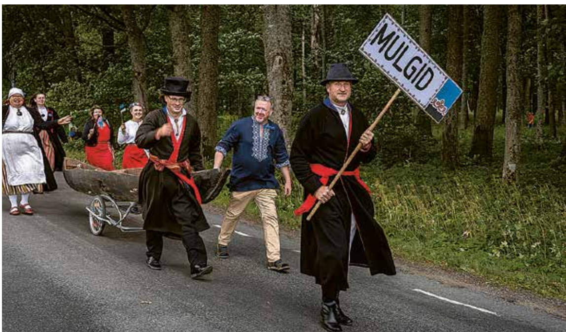
Üits selle suve suurembit ettevõtmisi olli Mulgi pidu, mes peeti Karksi pargin. Pildi pääl om rongikäik, kos ihenotsan ollive iki mulgi esi.

Viil om Allile tähtis laste vullklooripäev, mes koroonä peräst om