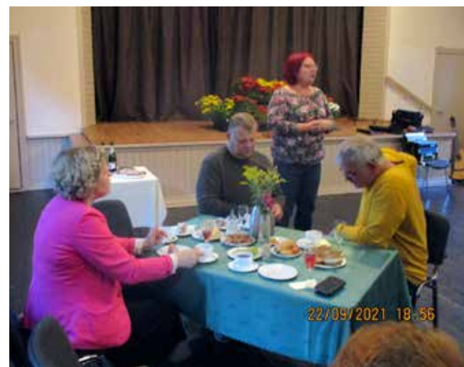
Volikokku kandideerijad kohtumas valijatega.