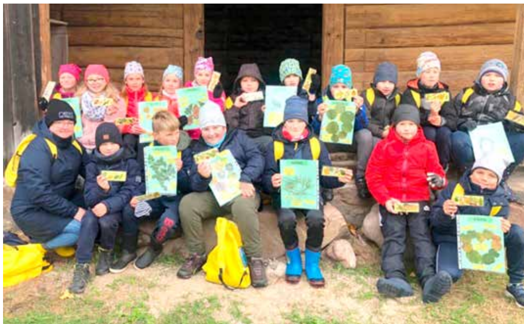
Pildil 3. klass.

Suur tänu Eesti Rahva- kultuuri Keskusele, kes rahastas Mulgimaa pärimuskultuuri toetusmeetmest August Kitzbergi nimelise Gümnaasiumi õpilastele mulgi keele ja kultuuri õpet Lilli Looduskeskuses. Projekti eesmärgiks on mulgi kultuuri tutvustamine ning mulgi keele õppimine, et laste seas ei hääbuks kodukohta ajaloolised oskused ja traditsioonid, et nad oleksid suutelised seda edasi andma, väärtustada ning säilitada oskuseid, tavasid ja kombeid, mis on seotud mulgi keele, kultuuri ja Mulgimaal tehtud talutöödega.