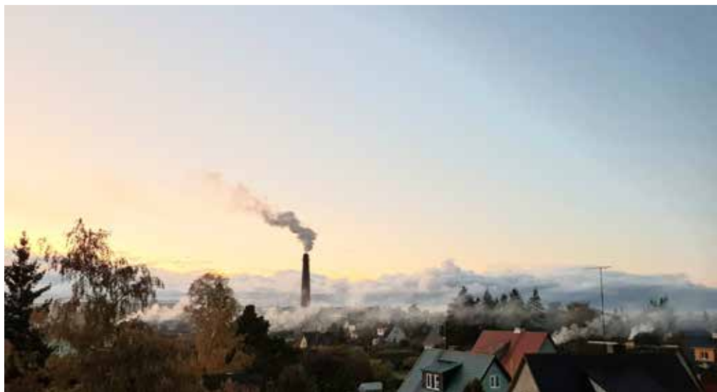
Kütteperiood toob kaasa korstnaist tõusvad suitsusambad.