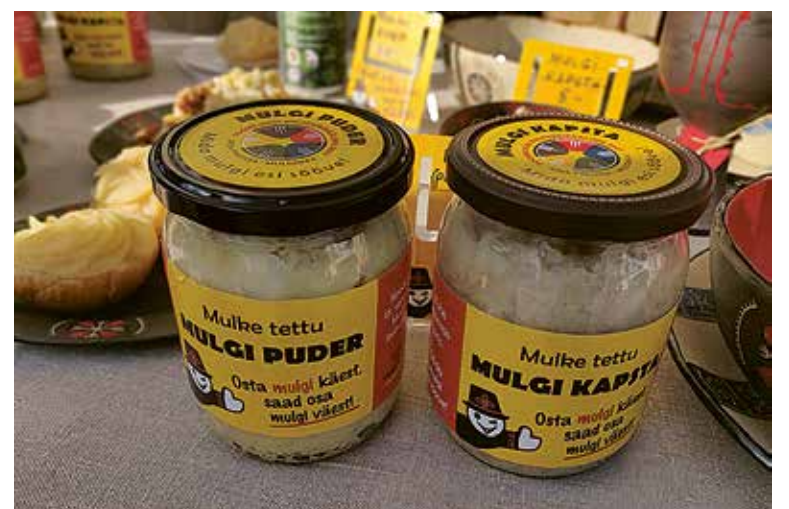
Mustla kohviku tettu Mulgi puder ja Mulgi kapsta ollive purki pant ja uhke mulgikiilse sildi pääle leebit.