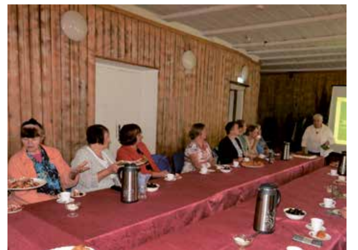
Haridusseltsi koosolek Karksi külamajas.