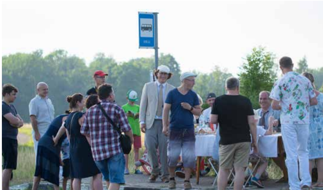
Kõige erikummalisem kohvik Kirju bussipeatuses.