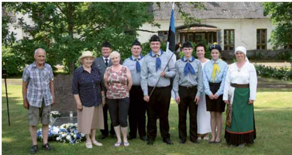
Õisu mälestuskivi juures.

Okupatsiooni eel loodud Presidendi võidutule üle maa laiali saatmise traditsiooni elustamisega alustati koheselt pärast iseseisvuse taastamist. 1994. aastal Tartus toimunud Kaitseliidu paraadilt jõudis Võnnus ja esimese laulupeo toimumispaias süüdatud ühendatud tuli Kaitseliidu ajaloolist väärtust omavatel maas-