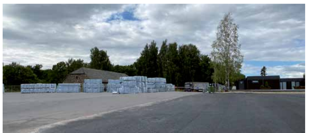
... ja samas paigas 2021.