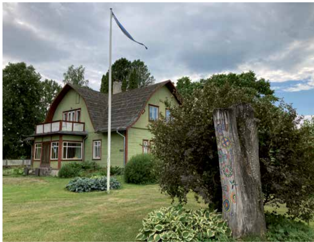
Murri häärberi kõrval seisab kaitsemaalingutega maamärk.

Murri häärber koos kõrvalhoonetega asub Mulgi vallas Muri külas Viljandi – Karksi-Nuia maanteel asuvast Muri bussipeatusest umbes 400 m kaugusel. Hoonet ümbritseb võimsate põlispude ja lopsaka taimestikuga vaarema-deagne aed ning taastatud park. Muri küla asub Tuhalaane-Suuga-Muri