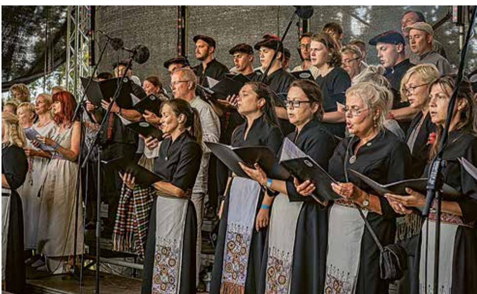
Mulgi segäkuur olli pidupäeväl püüne pääl laulman ja nädäl ennemb pidutuld läbi Mulgi-maa saatman.