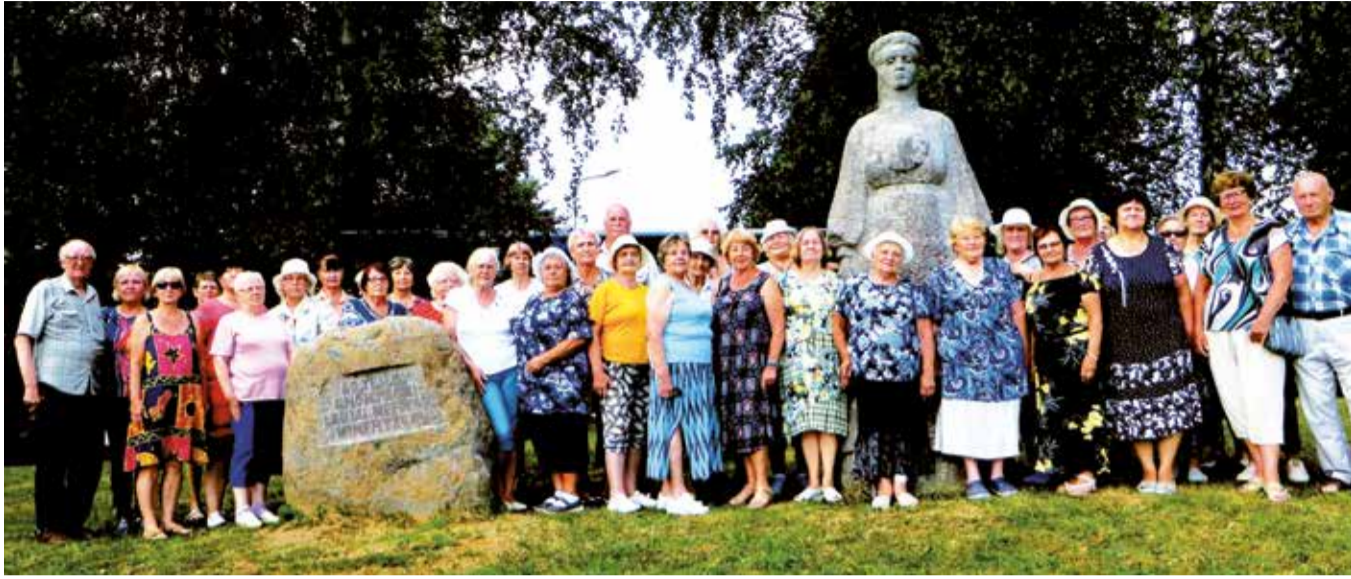
Reisiseltskond Lauuema kuju juures.