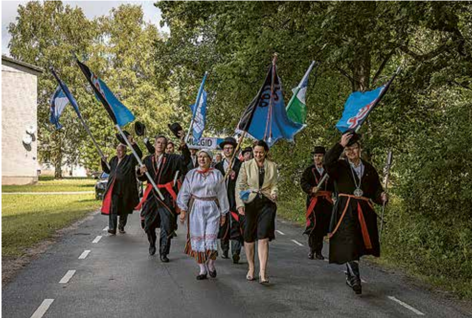
Pidupaika minti pikän rongikäigun läbi Karksi pargi.