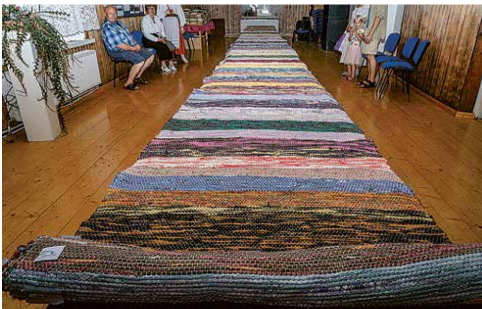
Karksi külämajan sai valmis õimuvaip, mida kudus poole aaste sihen ümäriguld 400 inimest ja pikkust tulli 10,5 miitred.