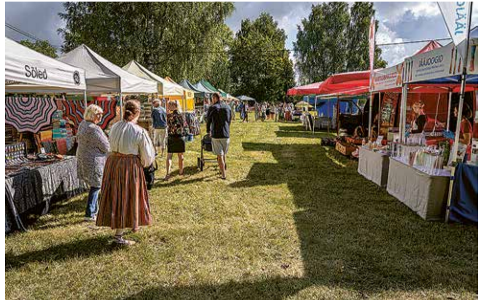
Pidupäev akas ommuku pääle suure laadage, kos sai osta ja müvvä egätsugust käsitüüd ja talukaupa.