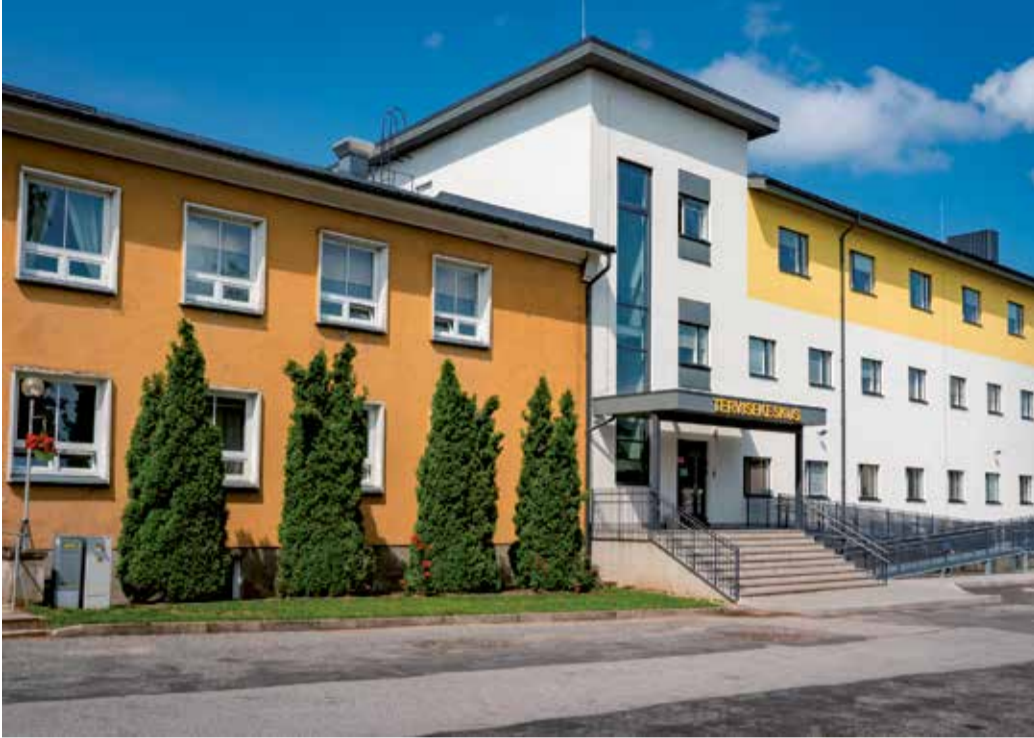
Abja-Paluoja esmatasandi tervisekeskus.