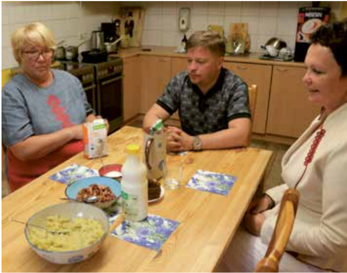
Magustoiduks valmistasime kamajook.