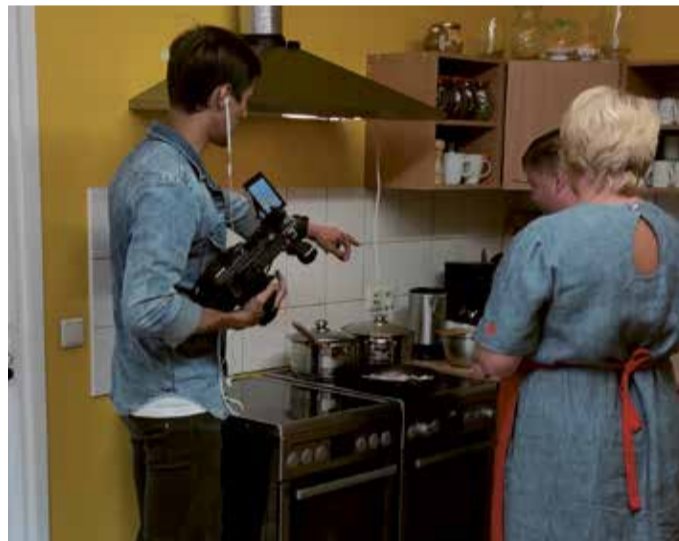
Filimine Abja päevakeskuses.