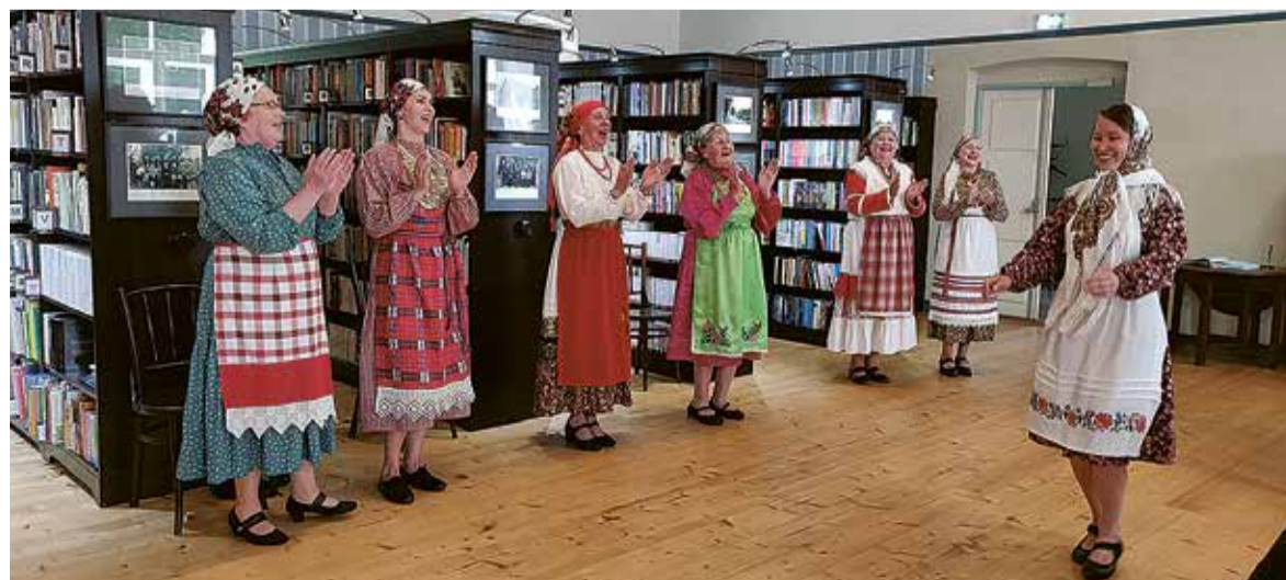
Udmurdi ansambel Ošmes panni o Kulla Leerimaja pörmandu pörume ja rahva rõõmust rõkkame.

Joba ärä ollu sündmuse pil- di ja rohkemb täadust sellest, mes tulemen, levvät mulgimaa. ee veebilehe päält, Mulgi Kul- tuuri Instituudi ja soome-ugri kultuuripäälinna Facebookist.