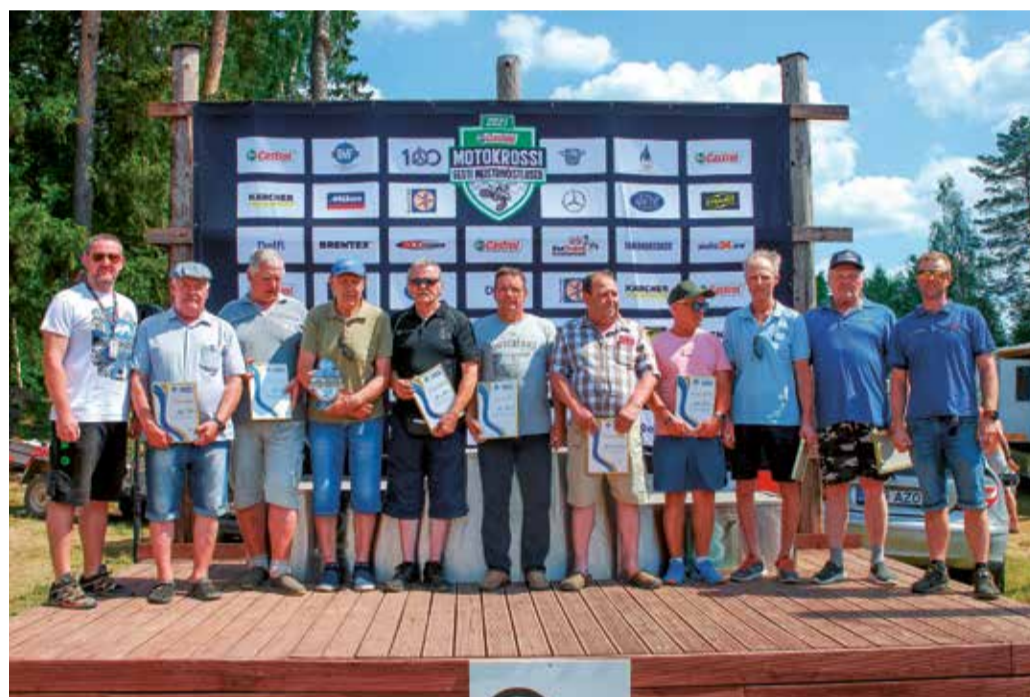
Endised teenekad krossisõitjad.