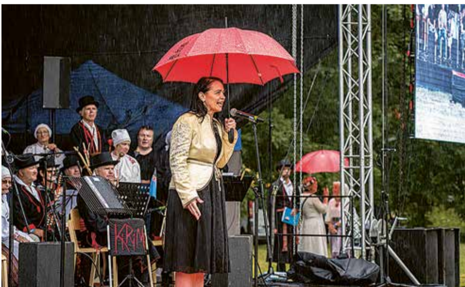
Mulke ja õimlasi olli pidupäeväl terviteme tullu kah kultuuriminister Oti Anneli.