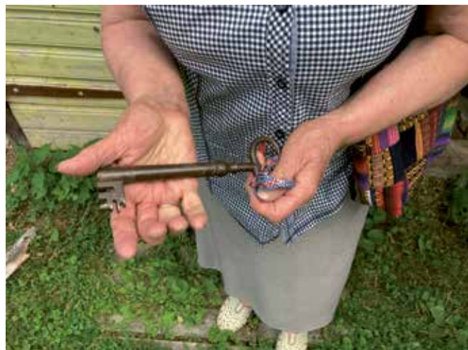
Pärand antakse edasi käest kätte.

Toimub ka korjandus Murri häärberi puitlaastkatuse renoveerimiseks. Annetus märgusõnaga „häärberi katus“ saab teha Karksi-Nuia Aianduse ja Mesinduse Selts EE871010302010435007 (SEB). Annetajaid tänatakse.