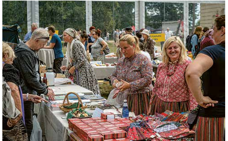
Terve päev olli valla suur õimutelk, kus soomeugrilase lähembelt ja kaugembelt saive oma asjust kõnelde ja kaupa müvvä.