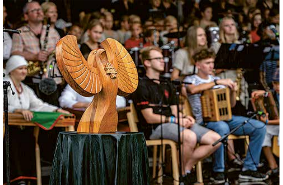
Karksin olli ka soome-ugri Sirk, kes aukotusse päält kigi piduliste üle valvas.