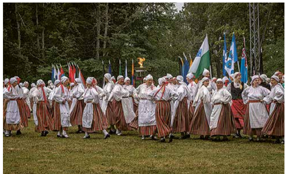
Paistku päe või kallaku vihmä – Mulgi naise tansive iki.