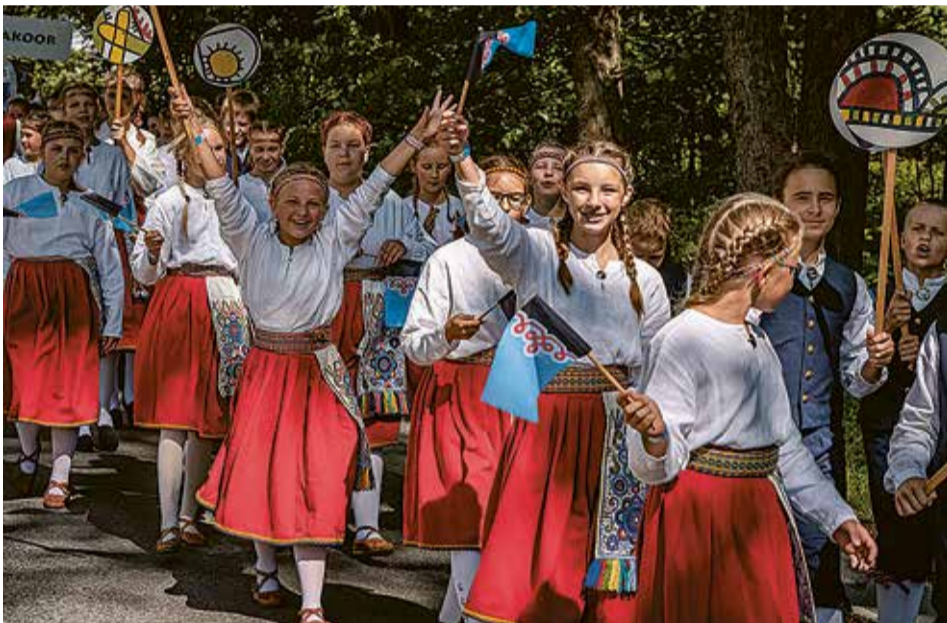
Kitzbergi gümnaasiumi 4. lassi rahvatantsurühm rongikäigun. Tuju om pidune.