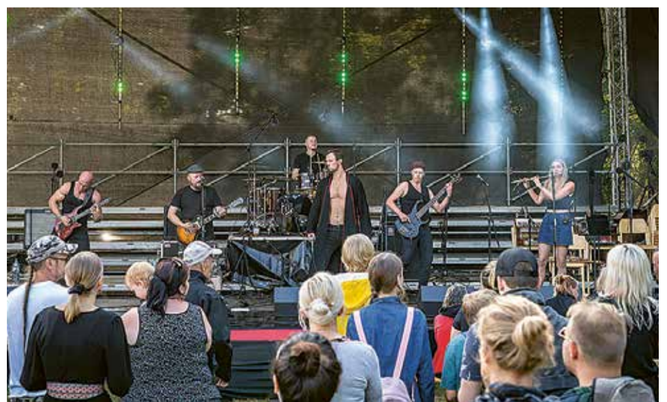
Ansambel Nikns Suns meelit püüne ette simmanile ulka nuuri.