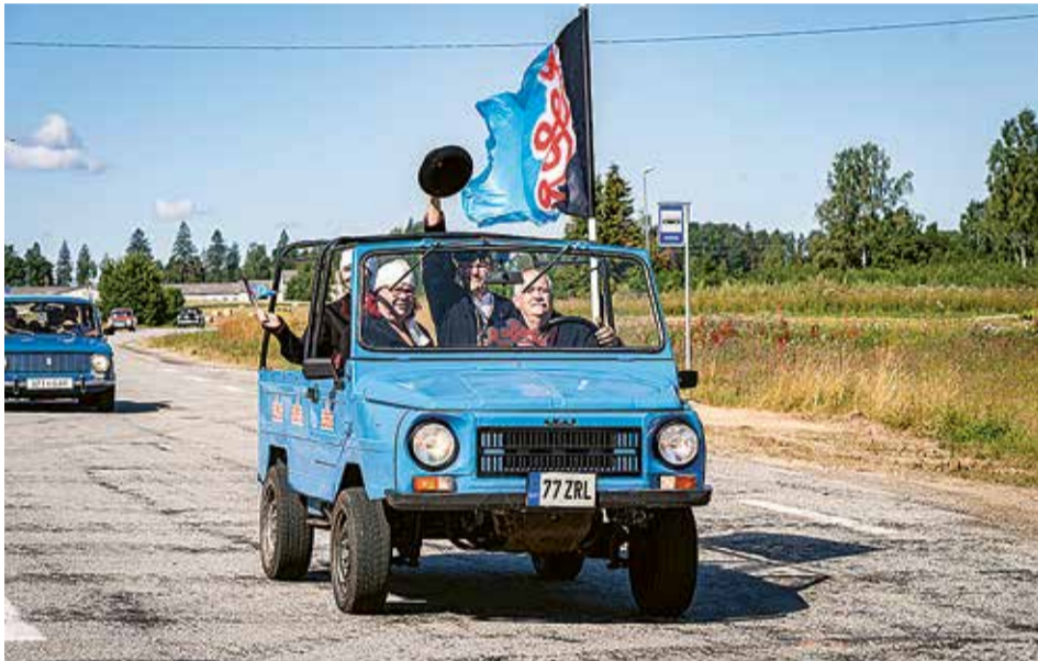
Pidutuli panti palame 24. juulil Härjassaare mäe pääl ja viiti vanade autudege üle Mulgimaa.

Mulgi pidu pääliskirjage “Mia ja sia ütenkuun” peeti 31. juulil Karksi mõisapargin. Kuna sii aaste om Abja-Paluoja üten kige Mulgimaage soome-ugri kultuuripäälinn, sis olli kah pidu pühendet õimurahvastele ja pidul võis näta kirvin rõõvin õimlasi oma kultuuri tutvustemen, laulman ja tantsman. Kuvvendest Mulgi pidust võtt osa 77 tantsu- laulu- ja pillipunti nii Mulgimaalt ku kaugembelt. Ülesastjit olli kokku ümäriguld 1000, kõrraldustoimkonna olli 20 inimest ja päältvaatejit arvati kokku paar tuhat. Rohkemb pidupilte levvät veebilehe mulgimaa.ee pildigaleriist. Järgmine Mulgi pidu tulep 2023. aastel Elme kihelkonna.