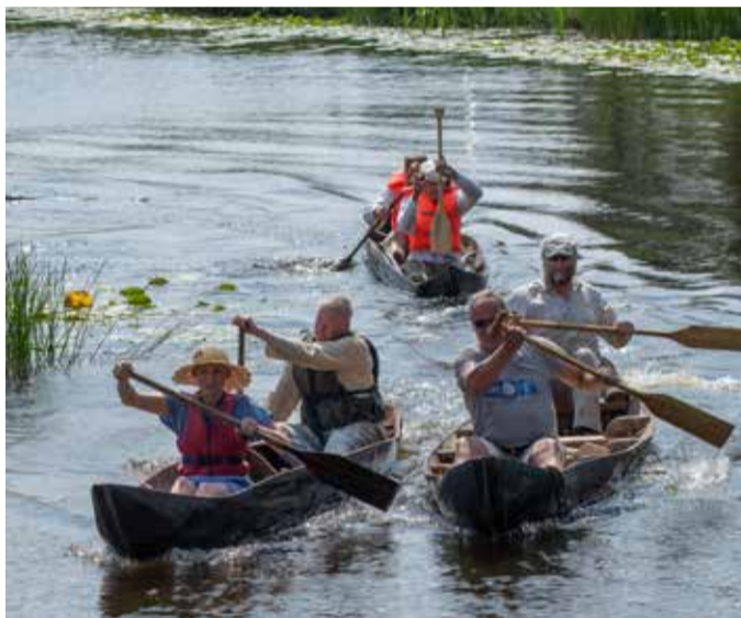
ABJA haABJAs 2021.