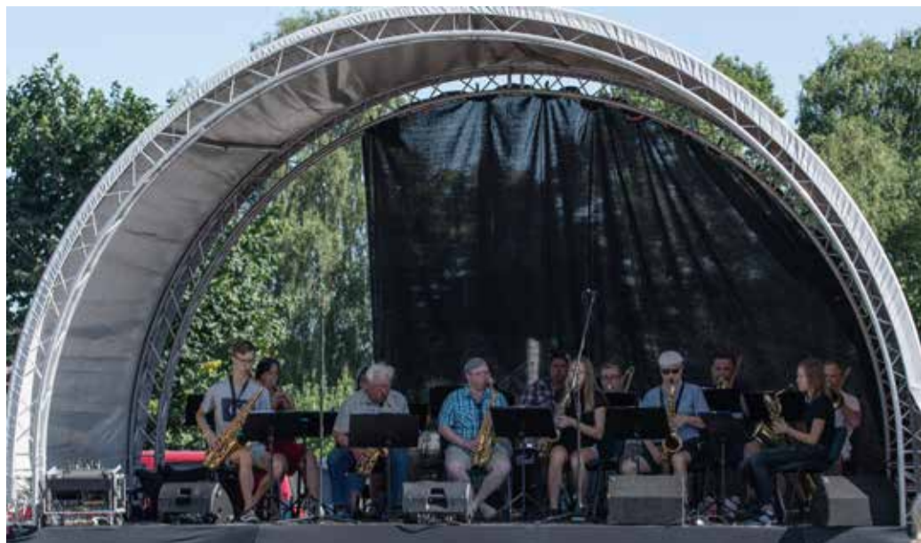
Päeva tõmbas laadalaval käima Mõisaküla Bigbänd.

Uus võistlus haabjaralli „ABJA haABJAs 2021“ meelitas seekord kohale kolm ühepuulootsikut, aga osalejate sõnul läheb asi käima ja järgmisel aastal pidavat järve „puid“ täis olema. Soome-ugri haabjaralli lahtiste