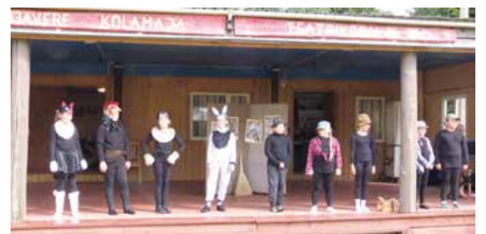
Andekad lapsed näiteringist Chipolino.

Viljandimaa koolinoorte teatripäev oli sel aastal planeeritud 18. märtsiks, kuid eriolukorra tõttu lükkus sündmus edasi sügisesse. Kooliaasta alguses saadeti sihtgruppidele uuesti info ja registreerimislehed. Konsulterides Eesti Harrastusteatri Liidu tegevjuhiga, otsustati riskide maandamiseks üritus korraldada virtuaalselt.