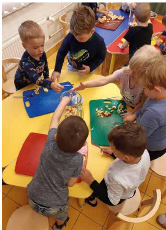
Kiisude rühma lapsed teevad smuutiit.

Esmalt tehti eeltöö rühmatundides, kus räägiti puu- ja juurviljade ning marjade kasvukohtadest Eestis ja lõunamaal. Arutleti, milliste sõiduvahenditega eksoteelised puuviljad meie toidupoodidesse jõuavad. Vaadeldi pilte ning lapsed said arvata, tehes plaksutusi ja patsutusi, kas tegemist oli Eestis või lõunamaal kasvava puuviljaga. Veel kompisid nad pimesi erinevaid puu-