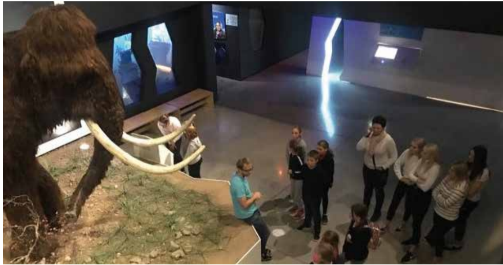
Jääaja Keskus pakkus avastamisrõõmu ja üllatust.

Esimesena soovisid lapsed näha Siidi, aga teda me kahjuks ei näinud. Nägime ja saime teada palju muud põnevat ning avastamisrõõmu oli tõesti igale vanusele. Tutvusime erinevate täies elusuuruses eelajalooliste loomadega. Kui meie soov näha Siidi ei täitunud, siis Mannyt nägime küll. Karvane mammut tervitas