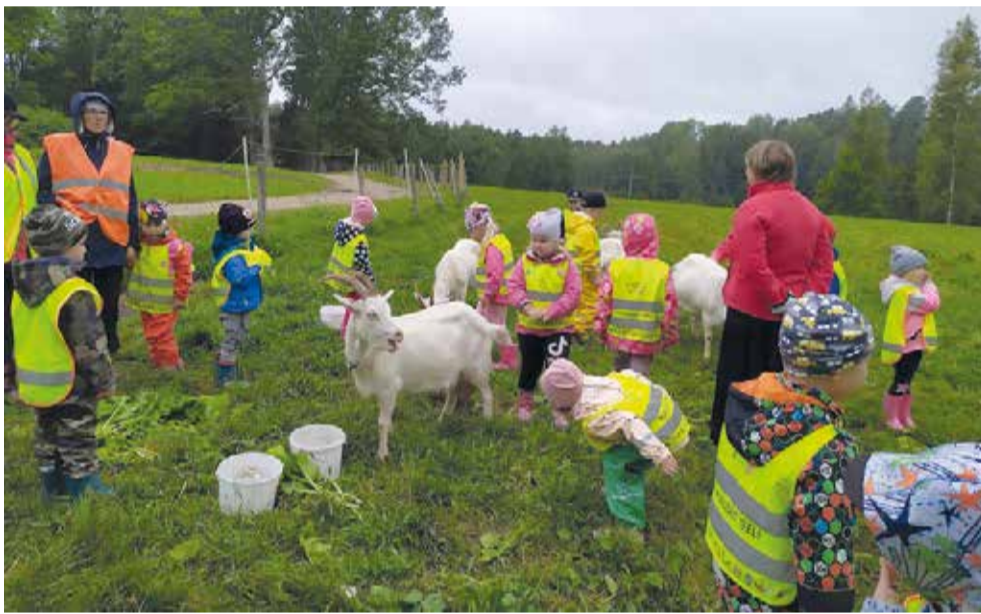
Jänkude rühm talus.