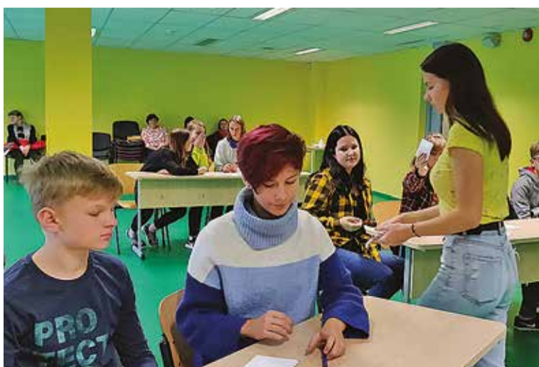
Koolinoorde mälumäng "Nupute" vällä töi Abja gümnaasiumise päid murdma kuus punit viiest eri koolist. Ihen Tarvastu võistkond.