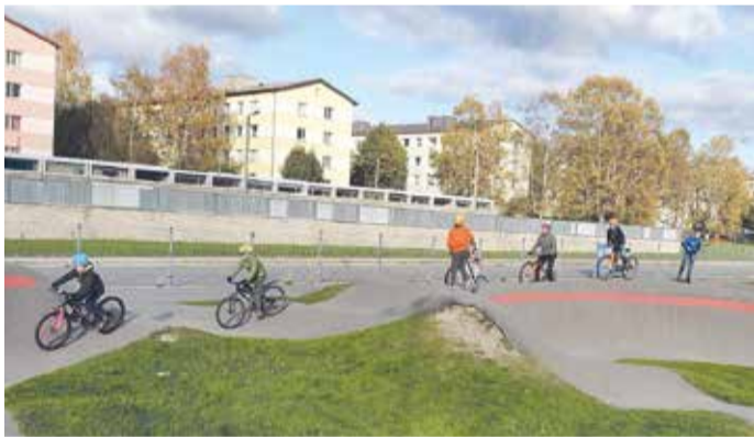
Põneval rattamatkal Pärnus.