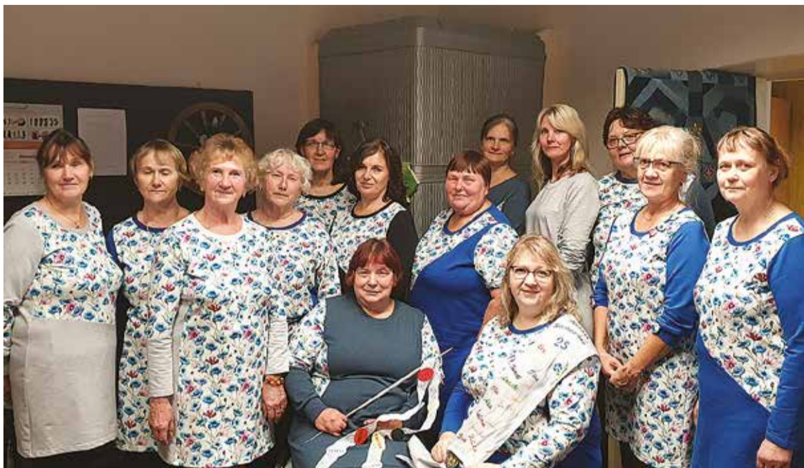
Riidajate käsitüüringin käip kuun ümägiguld 15 naist. Pidupäeväs ollive kik omal uvve lillilise leidi tennu.