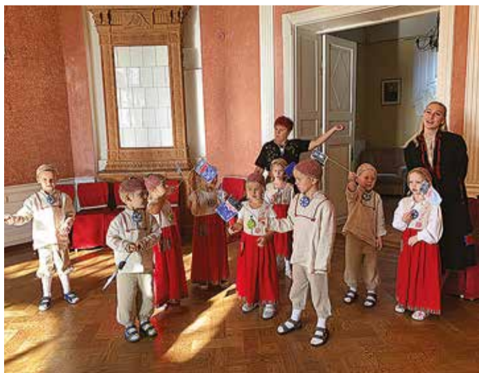
Et kige tillembe mulgi kah mulgi nädälist osa saas, ollive 15 Mulgimaa lasteaian 5.-16. oktoobreni omakultuuriommuksu, kos ütten Laande Allige lauleti ja mängiti mulgi keeli. Pildi pääl om Tarvastu lasteaia Kärsne maja latse, kes ollive pidupäeväs esi omal Mulgimaa lipu kah tennu.