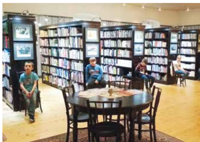
... ja raamatukoguga tutvumas.