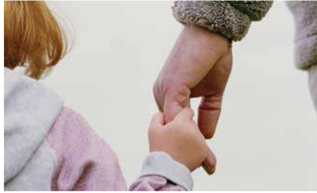
Mulgi valda sündis mullu 44 last.