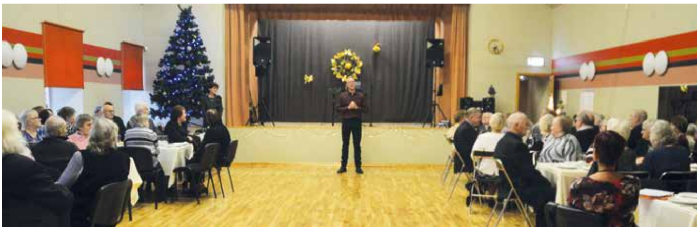
Jõuluootus tõi kokku terve saalitäie eakaid.