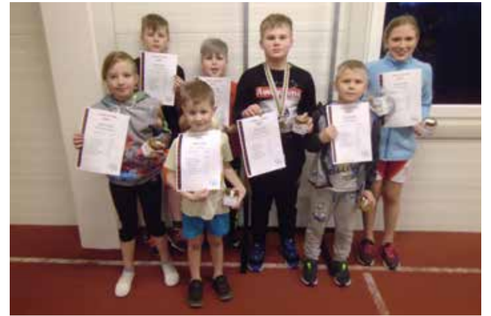
Võistlustel osalenud Mulgi valla noored tõstehuvilised.