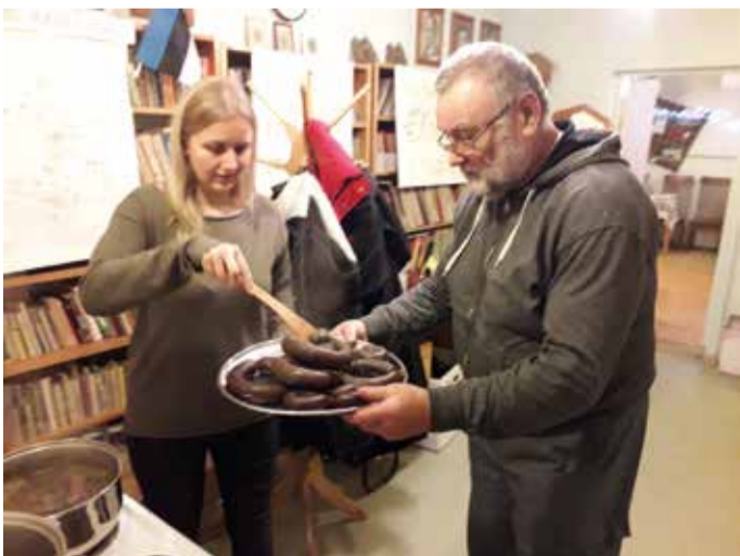
Esimesed kuppanud vorstid.

Kui kruubid podisesid, oli aega kohvi või teed juua ning rääkida mõnusaid jõulujutte. Vestluses selgus, et osalejad olid tulnud kogemusi saama ning lõpptulemusega soovisid sõpru ja sugulasi üllatada. Ega siis kõik ei ol-