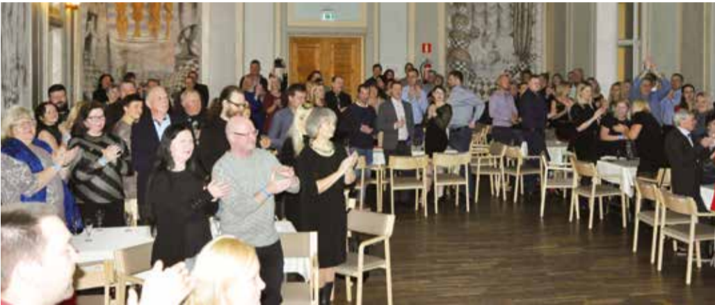
Külalised laulsid ansambli sünnipäevaks.