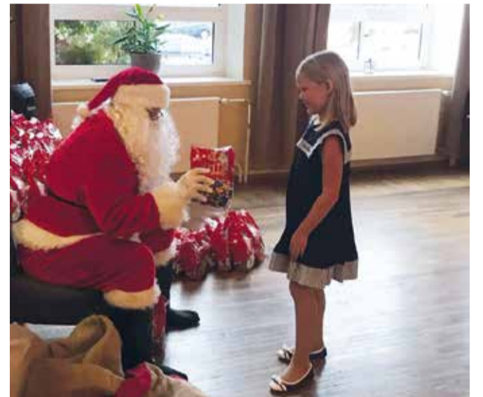
Jõuluvana kulla pai, nii ma kommipaki sain.