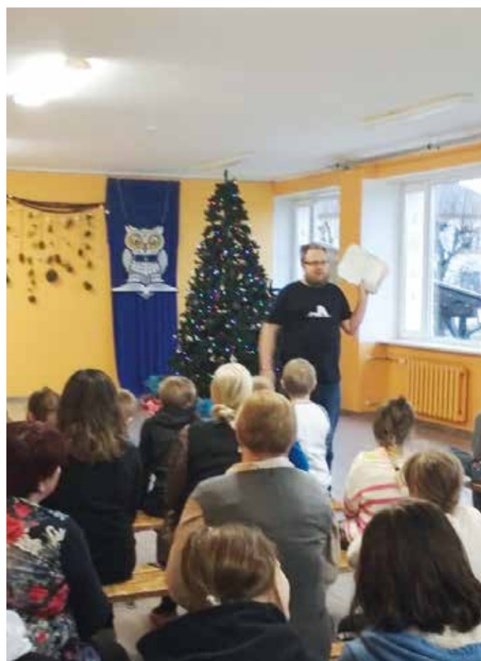
Contra kohtumisel Mõisaküla koolis.

Spordijutu jätkuna üllatusime, et Mõisakülast on pärit lisaks kõigile teada-tuntud Arnold Luhaäärele veel üks olümpiamedalist: Adalberts Bubenko, kes aastal 1936 Berliini OMil 50 km käimises pronksmedali võitis. Paraku oli tal küll au sündida Mõisakülas, kuid juba lapseas asuti Valmierasse elama ning sestap peab Läti teda ikkagi oma sportlaseks.