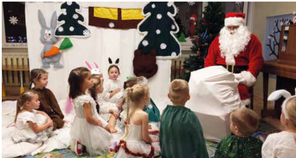
Õisu lasteaia jõulupidu.